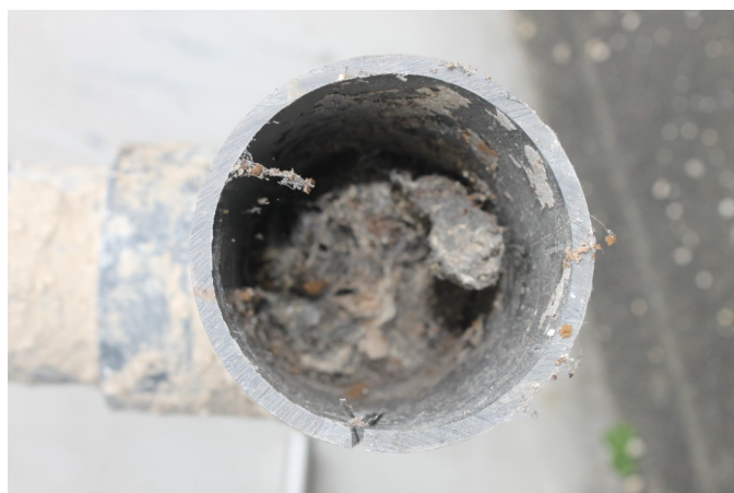
Canalisation obstruée par une serpillière

Il faut veiller à n'introduire aucun produit nocif susceptible de détruire les bactéries épuratrices ni aucun objet risquant d'endommager les pompes.