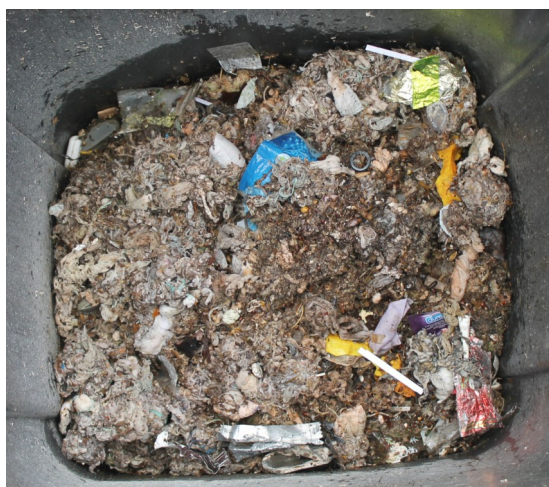
Une partie des déchets indésirables jetés chaque semaine

La station travaille en flux tendu. S'il y a un problème il faut être très réactif car il n'y a pas de zone tampon permettant de stocker les arrivées. On retrouve trop d'encombrants (tampons, lingettes jetables mais aussi éponges sans parler des serpillières en coton et des cailloux parfois) qui occasionnent des pannes sur les pompes ou les canalisations.