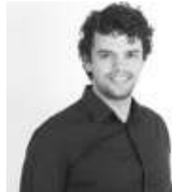
DIRECCIÓN Y AUTORIA RUBÉN DARÍO