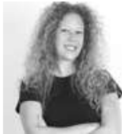
DIRECCIÓN Y AUTORIA GUACIMARA CORREA