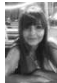
AUTORÍA ANNA VANDERWILDE