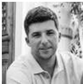
AUTORÍA MIGUEL ÁNGEL MARTÍNEZ