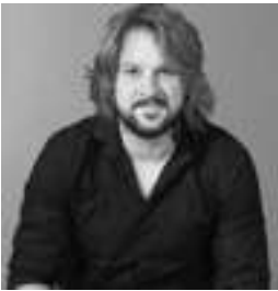
DIRECCIÓN Y AUTORIA LUIS O 'MALLEY