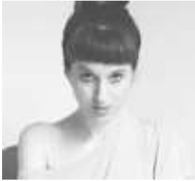
DIRECCIÓN GUAXARA BALDASSARRE