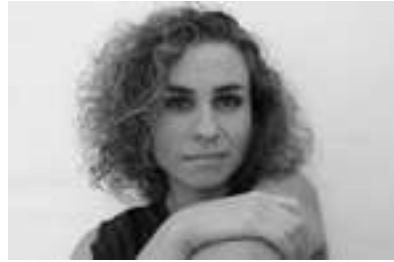
DIRECCIÓN RUTH SÁNCHEZ