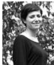
AUTORÍA VICTORIA ORAMAS