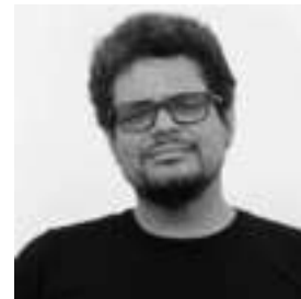
AUTORÍA PACO SÁNCHEZ