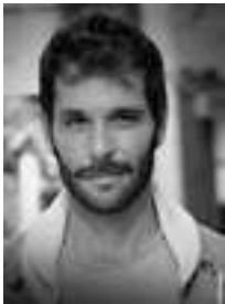
AUTORÍA MAYKOL HERNÁNDEZ