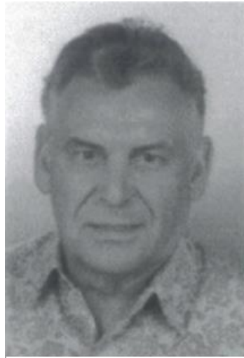
Heinz Rothengatter 2002