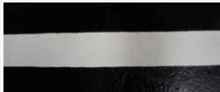
Gereinigte und abgetrocknete Bereiche.