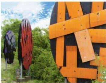
Hans Hendrik Grimmling „Freiheit-Liebe-Tod“ 1999

„Skulpturenweg“ Verbindet auf einer Strecke von 12 Kilometern die ehemaligen Klöster Brunshausen und Lamspringe – beliebt bei Spaziergängern, Radlern und Skatern.