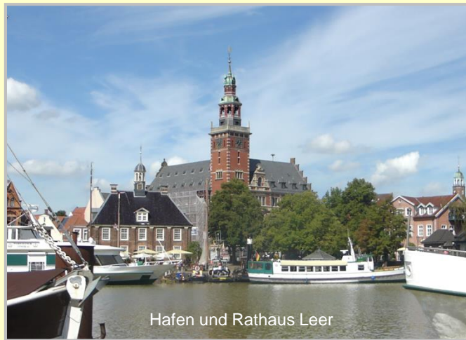
Hafen und Rathaus Leer

Zu diesem Gebiet gehört auch der Elisabethfehnkanal als unersetzliches Baudenkmal der Fehnsiedlungen dieser Region. Einst durchzogen unzählige von Hand gegrabene Kanäle das Gebiet zwischen Ijssel und Weser, um die bis dahin unwegsamen Moore zu erschließen. Nur dieser harten Pionierarbeit ist es zu verdanken, dass diese Landstriche bewohnbar wurden und Ackerflächen geschaffen wurden.