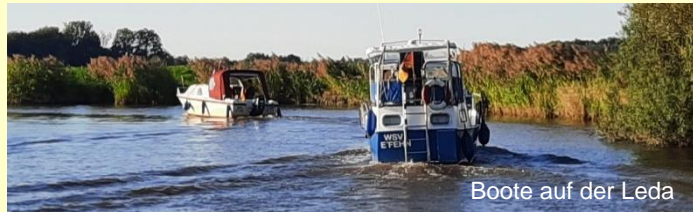
Boote auf der Leda

Der südlichste Hafen ist nach dem Durchfahren des Elisabethfehnkanals in Kamperfehn. Hier beginnt die direkte Anbindung an den Küstenkanal und somit auch an Oldenburg und Dörpen.