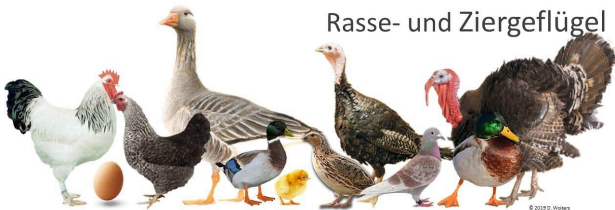
Rasse- und Ziergeflügel

vom 04.11.2022 in der Halle der LandTage Nord in Wüstring