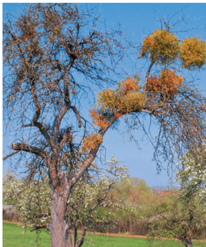
Starker Mistelbefall führt zum Tod von Apfelbäumen