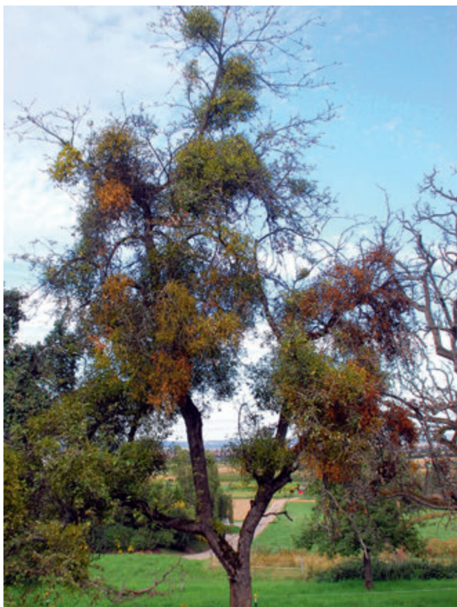
Hier zeigt sich bereits deutlich ein beginnendes Aststerben

der Mistel hat. Wenn hier nicht bald eine Änderung eintritt, kommt es in den nächsten Jahren zu einem katastrophalen Ausfall von Apfelbäumen. In manchen Gewannen sind schon heute bis zu einem Viertel der Apfelbäume abgestorben bzw. es ist sichtbar, dass sie in den nächsten Jahren absterben werden. Für die Mistel ist das ebenfalls tragisch, denn mit dem Baum stirbt auch sie ab, d.h. sie begeht praktisch Selbstmord. Für die Natur spielt das aber keine Rolle, denn die Mistel hat sich bis zu diesem Zeitpunkt schon hundert- wenn nicht gar tausendfach vermehrt.