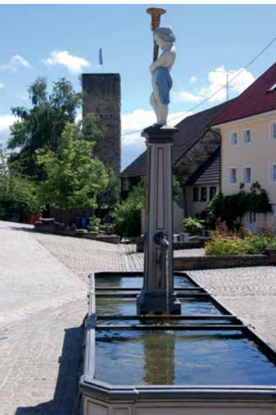
Der Brunnen der Altstadt und der Hinterburgturm im Hintergrund.