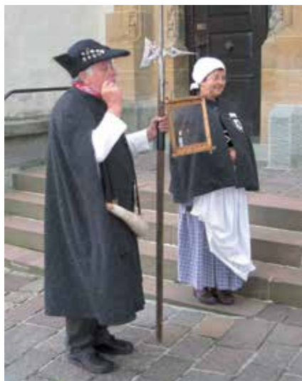
Bei einer Stadtführung mit dem Nachtwächter und der Bürgersfrau bekommen die Besucher einen ganz besonderen Einblick in die Stadt.

Der Touristik-Verein betreibt eine schöne Grillanlage und eine Blockhütte, die für Vereine, Firmen oder auch für Familienfeste gemietet werden können. Es ist auch möglich ein Festzelt (6x6m) auf das Gelände zu stellen, so daß auch größere Gruppen dort festen können. Mittlerweile sehr beliebt für Firmenfeste. Von hier aus haben Sie einen wunderschönen Ausblick über den Hegau bis hin zum Bodensee. Unser Verein hat sich zum Ziel gesetzt, dass Urlauber, Gäste, Bevölkerung immer was Neues geboten bekommen und daher würden wir uns freuen, wenn Sie uns in Engen besuchen.