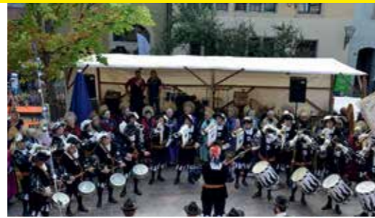
Bilder: Historischer Fanfarenzug Engen

Du hast Lust auf einen aktiven Verein, bei dem Spaß und Kameradschaft an erster Stelle stehen? Auf alljährliche Auftritte und Ausflüge, die Du so schnell nicht mehr vergessen wirst? Dann besuch uns doch einfach in einer unserer Freitagsproben, immer um 20 Uhr am Vereinslokal Dielenhaus, oder melde Dich über E-Mail oder unseren Facebook Kanal.