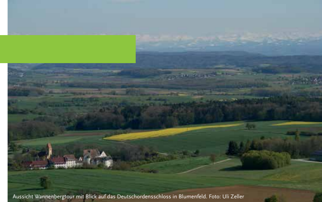
Aussicht Wannenbergtour mit Blick auf das Deutschordensschloss in Blumenfeld.

Durch die naturnahe Lage Tengens finden Naturliebhaber ihr kleines Paradies. Herrliche Premiumwanderwege wie der „Wannenbergtour“ oder dem „Alten Postweg“ ermöglichen herrliche Blicke auf die Alpen und bei Föhn sogar auf den Bodensee. Vielfältige Freizeitangebote wie Baden, Tennis, Fußball, Spielplätze, qualifizierte Nordic-Walking-Strecken und Skilanglauf-Loipen runden das Angebot ab. Ideal für Ihren nächsten Urlaub!