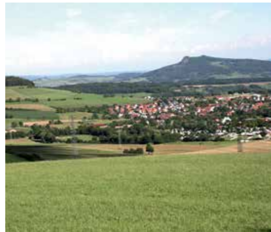
Blick auf Tengen und den Hegau