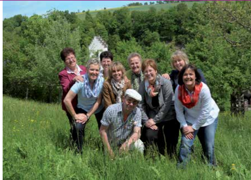
Nicht wegzudenken in Zimmerholz: Die engagierten Sänger des katholischen Kirchenchors tragen zum lebendigen Vereinsleben der Dorfgemeinschaft bei.

Nach dem Motto klein aber fein kommt es auf jeden einzelnen Sänger an, so ist keiner „Einer von Vielen“. Mit ca. 10 Auftritten pro Jahr wird keiner überfordert und doch ist jeder Vortrag eine