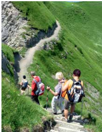
Wandern in den Bergen

Sind Sie gerne aktiv in der Natur? Auf Schusters Rappen oder auch per Drahtesel nehmen wir Sie mit auf unsere Halb- und Ganztagestouren. Wir sind ein Verein aus dem Hegau-Vulkangebiet.