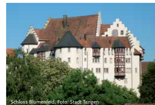
Schloss Blumenfeld.

Die freigelegte und restaurierte Anlage ist die zweitgrößte seiner Art in ganz Baden-Württemberg und Bayern. Die Anlage wurde vermutlich um 75/80 n.Chr. errichtet, das Ende wird auf Grund von Funden auf ca. 263 n.Chr. festgelegt.