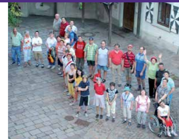
Der Name Swimmy stammt aus einer Kindererzählung über einen kleinen Fisch, der herausfand, dass man im Schwarm - mit vereinten Kräften - vor großen Fischen geschützt ist.