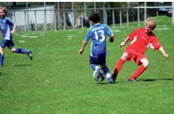
Spiele können nur gemeinsam im Team gewonnen werden. Beim HFV wird Kameradschaft groß geschrieben.

Beim Hegauer Fußballverein (kurz: HFV) dreht sich alles um den Fußballsport. „Gemeinsam stark...“ war das Motto und die Motivation für den 2007 erfolgten Zusammenschluss der Fußballvereine VFR Engen und FC Welschingen-Binningen. Der HFV gehört