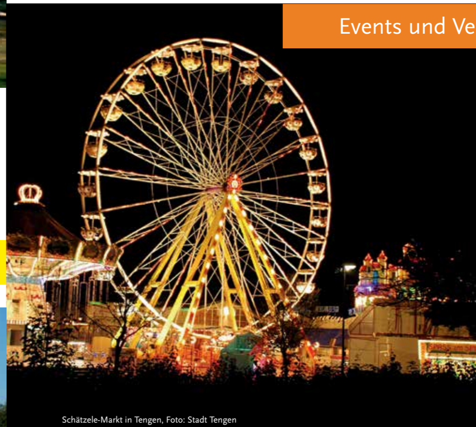
Schätzele-Markt in Tengen.

Das ganze Jahr über gibt es in Tengen ein umfassendes Veranstaltungsprogramm von Ausstellungen, Konzerten, Theater über Märkte und Feste bis hin zu Sportveranstaltungen. Alle Veranstaltungen finden Sie in unserem Veranstaltungskalender unter www.tengen.de . Der Schätzele-Markt ist mit über 100.000 Besuchern das größte Volksfest der Region und eines der wichtigsten in Südbaden. Seit über 725 Jahren feiert die Stadt Tengen den Markt am letzten Oktoberwochenende. Die älteste der Stadt Tengen vorliegende Urkunde über Märkte stammt aus dem Jahr 1291 als König Rudolf von Habsburg der Stadt Tengen-Hinterburg die Abhaltung von Jahr- und Viehmärkten erlaubte. Präsentiert wird neben der Leistungspalette des Handels und des Handwerks, ein buntes Festzeltprogramm und ein großer Vergnügungspark.