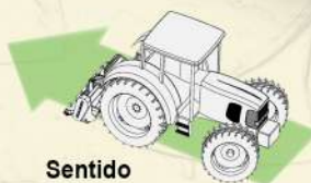
Sentido de trabajo