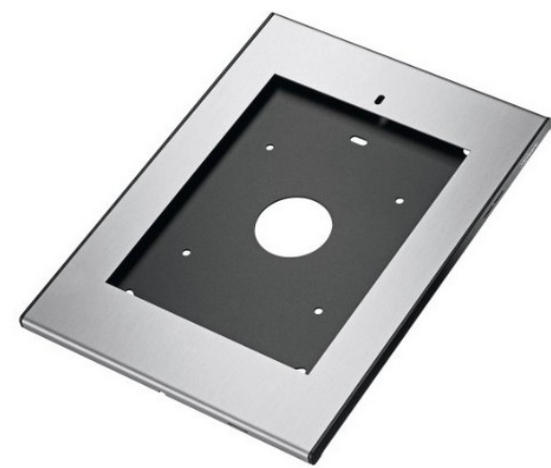
iPad-Homebotton nicht zugänglich