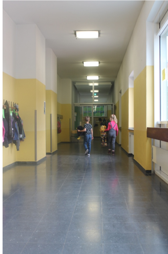
der obere Flur