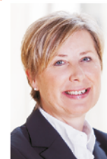
Ina Spanier-Oppermann Landtagsabgeordnete