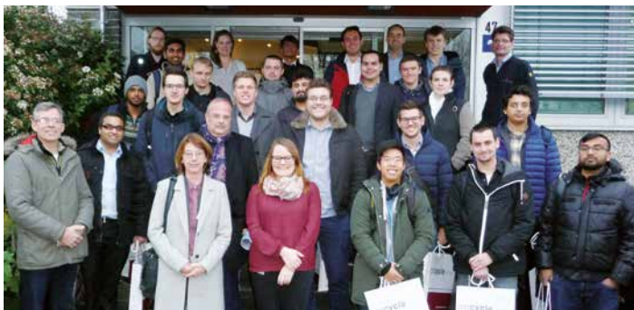
20 Studenten von zwei Hochschulen zu Gast in Kempen

2006 und ist weltweit der größte selbständige Konstrukteur und Produzent von Energiesteuerungs-lösungen für Flugzeug- und Industriemotoren. In Kempen befindet sich die Zentrale für den Vertrieb, die Entwicklung, Fertigung und Service von Umrichter-systemen für Windkraftanlagen. Mehr als 14.000 installierte Umrichter sowohl in Off-Shore- wie in On-Shore-Anlagen bezeugen die große Kompetenz und Erfahrung dieses Unternehmens. Bei einer Betriebsbesichtigung erfuhren die Studenten, dass in Kempen 320 Mitarbeiter beschäftigt werden und Woodward insgesamt an 34 Standorten in 17 Ländern zu finden ist. Das Unternehmen bietet Studenten sowohl Werkstudentenstellen und Praktika wie Master- und Bachelorarbeiten. (jk-)