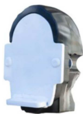
Cabeza/pecho AR500 HC