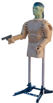
MARIO 500 AR500 HC