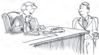
Fach- und Führungskräfte fördern