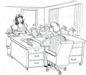
Ersatzplanung für wertvolle Mitarbeiter