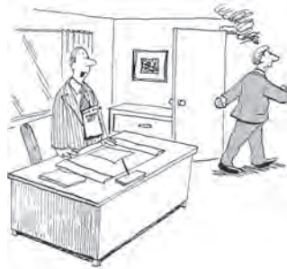
Personalverlust- und Nachbesetzungsrisiko