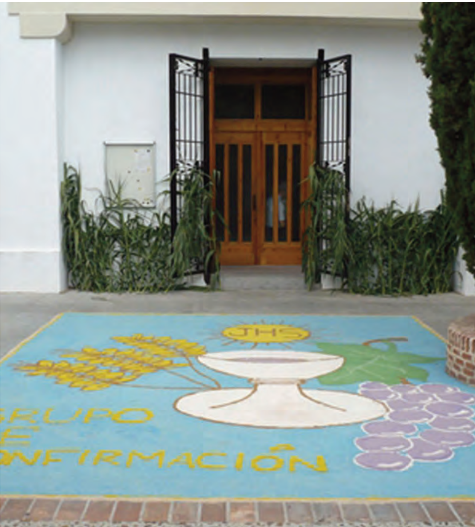
Alfombra del día del Corpus hecha en colaboración con el Grupo de Confirmación