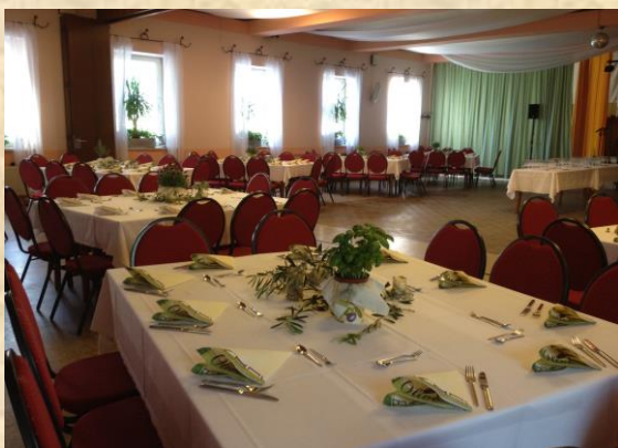
Der große und kleine Saal ( bis zu 200 Plätze )

Der große und der kleine Saal sind geeignet für Versammlungen, Familienfeiern (Taufe, Kommunion, Hochzeit, etc.) und Festlichkeiten aller Art. Sie können getrennt von der Gaststube Ihre Veranstaltung ungestört genießen. Bei Bedarf kann der große und kleine Saal zusammengelegt werden und bietet dann Platz für bis zu 200 Personen.