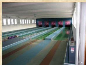
Die Kegelstuben und die Kegelbahnen

und für Schützenvereine und Sportschützen die Luftgewehrhalle, die KK- und die Pistolen- Schießstände des