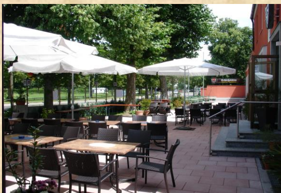
Unser Biergarten lädt Sie zur „Freiluft-Saison“ ein

Ideale Räumlichkeiten für Familien-, Betriebsfeiern und Festlichkeiten. Gastraum 50, kleiner Saal 60, großer Saal 120, zusammen bis zu 250 Plätze. 5 automatische Kegelbahnen mit Kegelstuben.