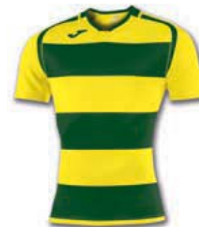
■ ■ 100735.459 YELLOW/GREEN