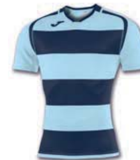
■ ■ 100735.312 SKY/DARK NAVY