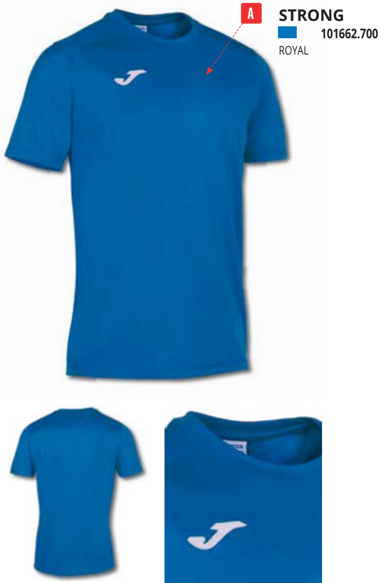
A STRONG ■ 101662.700 ROYAL