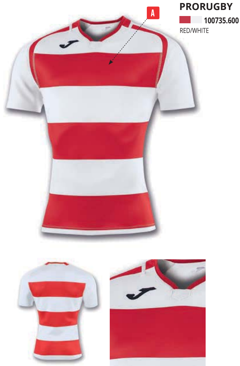
PRORUGBY ■ ■ 100735.600 RED/WHITE