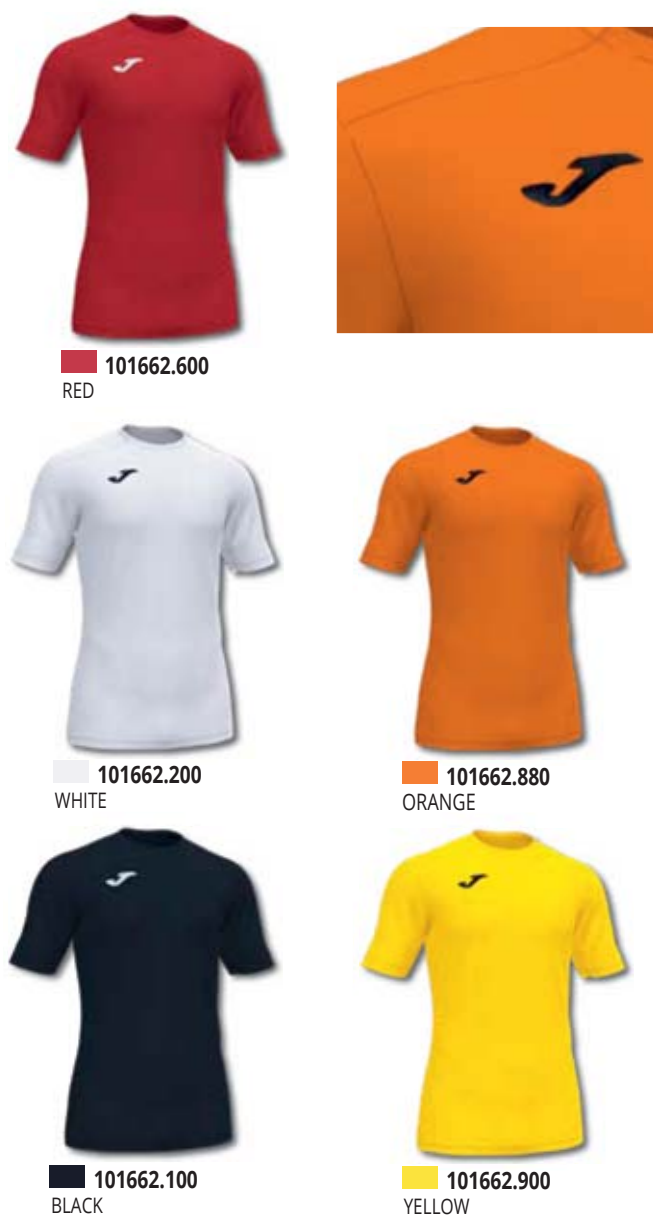
■ 101662.600 RED