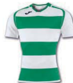
■ ■ 100735.450 GREEN MEDIUM/WHITE