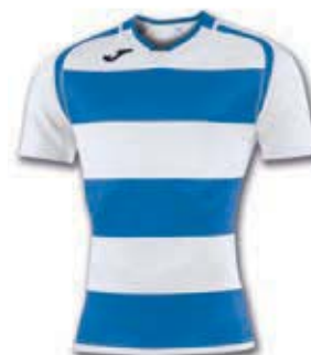
■ ■ 100735.700 ROYAL/WHITE