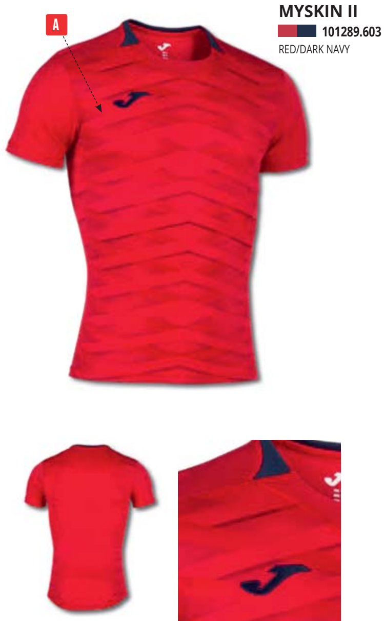
MYSKIN II 101289.603 RED/DARK NAVY