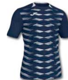
101289.332 DARK NAVY/WHITE