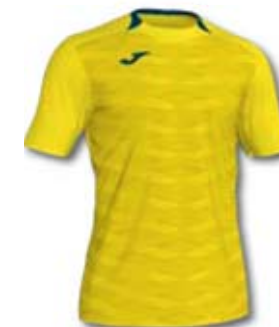
101289.903 YELLOW/DARK NAVY