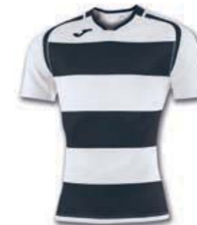
■ ■ 100735.100 BLACK/WHITE