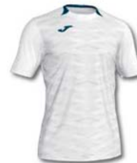
101289.203 WHITE/DARK NAVY