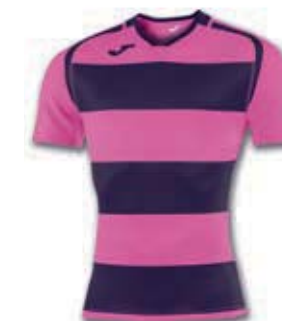
■ ■ 100735.305 RASPBERRY/DARK PURPLE