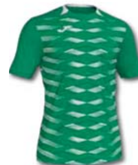
101289.452 GREEN MEDIUM/WHITE