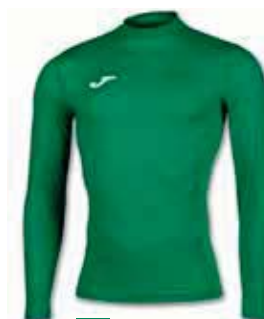
101018.450 GREEN MEDIUM