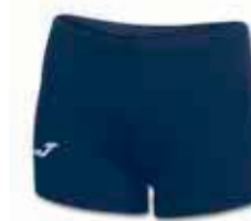
900477.331 DARK NAVY