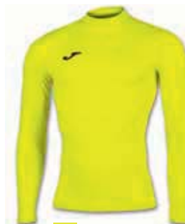
101018.060 YELLOW FLUOR