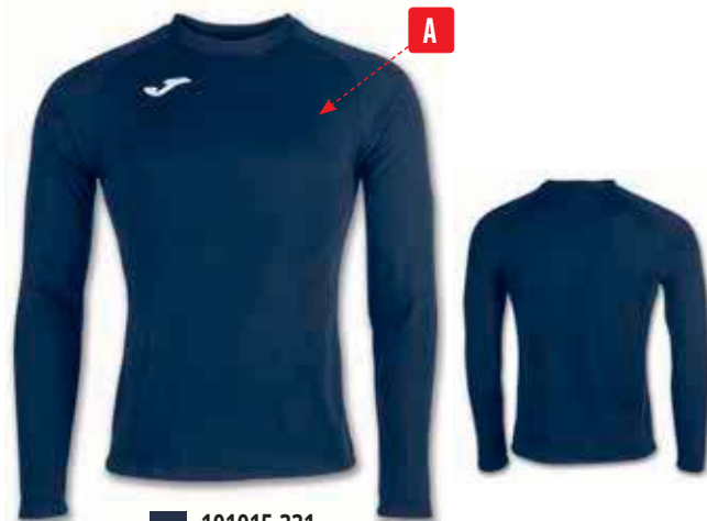
101015.331 DARK NAVY