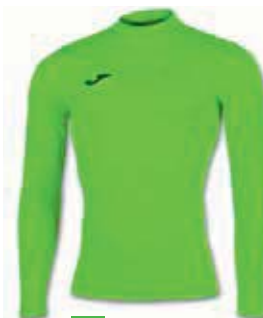
101018.020 GREEN FLUOR