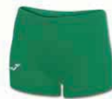
900477.450 GREEN MEDIUM