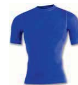
100765.701 DARK ROYAL