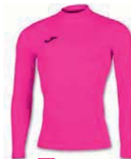
101018.030 PINK FLUOR