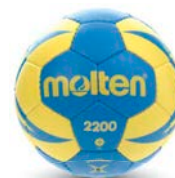
Ref. 11470 H0X2200 T.0