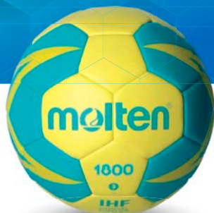
Ref. 14620 H3X1800 T.3

Categoría: Balonmano Color: Amarillo, verde Construcción: Cosido a máquina Nº paneles: 32 paneles Material recubri.: PU Cámara int.: Latex Recomendación: Indoor