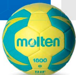
Ref. 14622 H2X1800 T.2