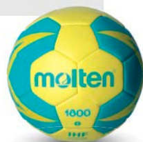
Ref. 14621 H1X1800 T.1