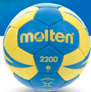
Ref. 11473 H3X2200 T.3

Categoría: Balonmano Color: Azul y amarillo Construcción: Cosido a mano Nº paneles: 32 paneles Material recubri.: PU Cámara int.: Látex Recomendación: Indoor