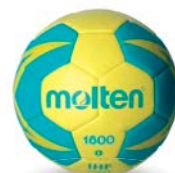
Ref. 14619 H0X1800 T.0