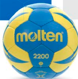
Ref. 11472 H2X2200 T.2