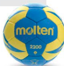
Ref. 11471 H1X2200 T.1