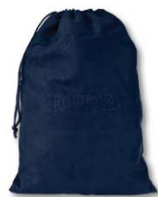
331 DARK NAVY