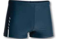
331 DARK NAVY