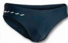
331 DARK NAVY