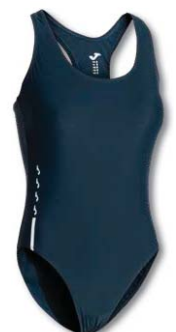
331 DARK NAVY