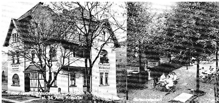
Restaurant Böhle in einer Ansichtskarte von 1913