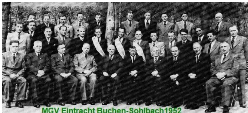
MGV Eintracht Buchen-Sohlbach 1952