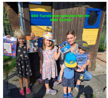
SSV Turnlöwe spenden Malbücher und Farbstifte