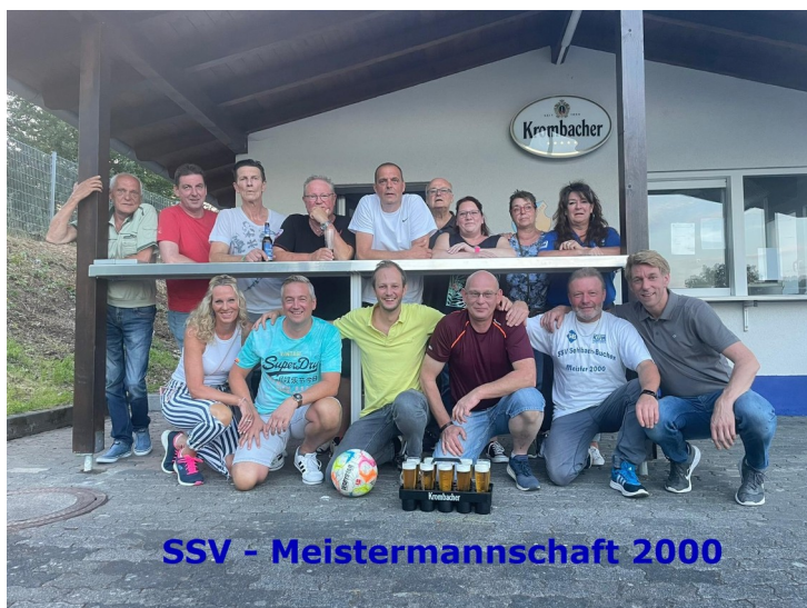
SSV - Meistermannschaft 2000