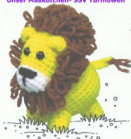
Unser Maskötchen- SSV Turnlöwen

Der SSV - Nachwuchs steht rechts in voller Sportkleidung und die SSV- Turnlöwen spenden Malbücher und Farbstifte für ihre schöne SSV Kids Corner