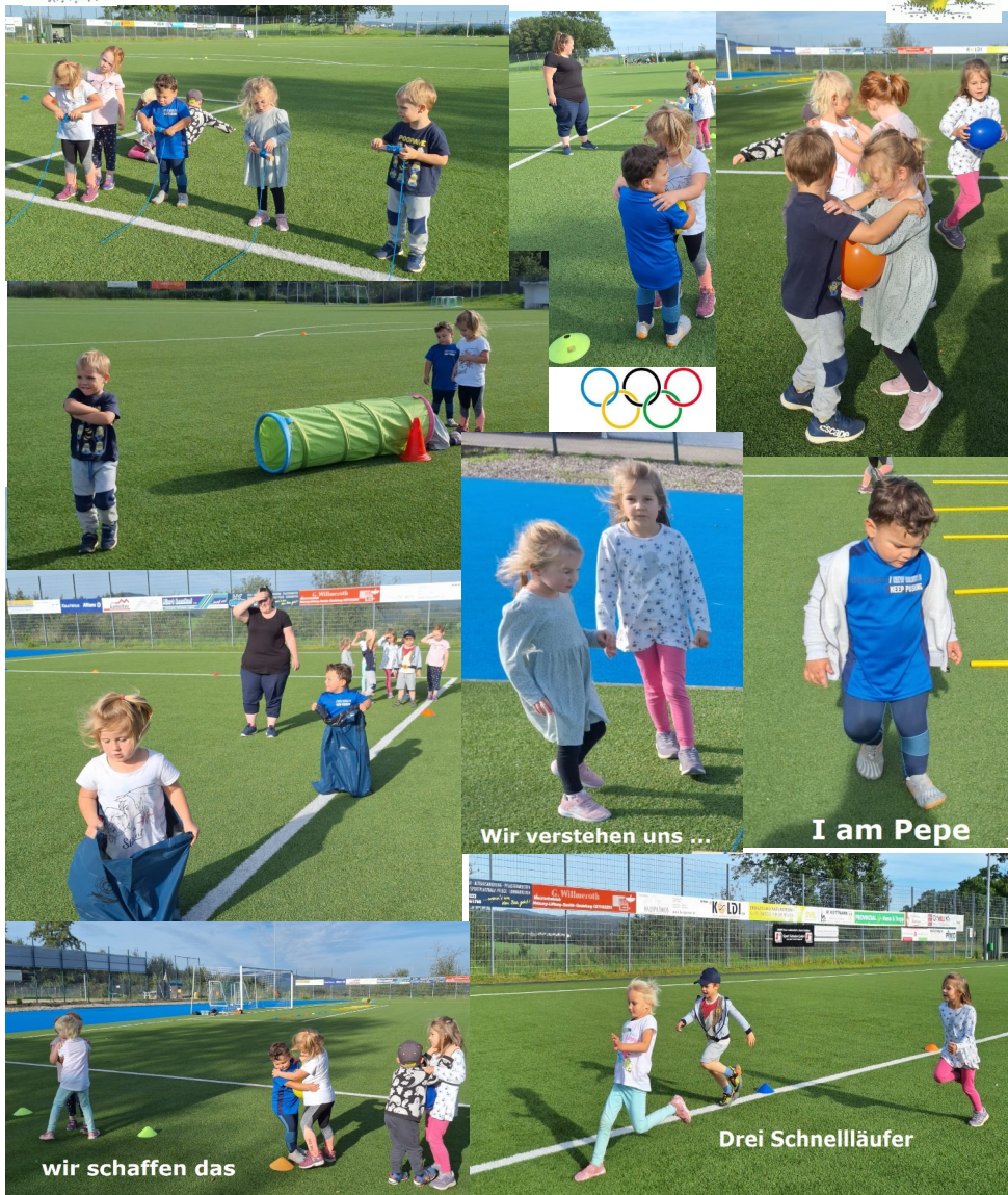
Wir verstehen uns ...