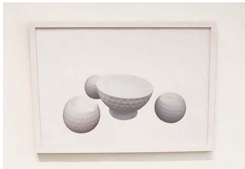
Catherine Ludwig MG-Möbel Jakobstad 01 und 02, 2016/18 C-Print gerahmt 40 x 60 cm ed. 4 + 1