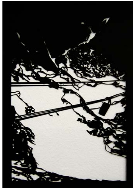
Catherine Ludwig Zugspitze 02, 2017 Karton gerahmt 30 x 40 cm Unikat