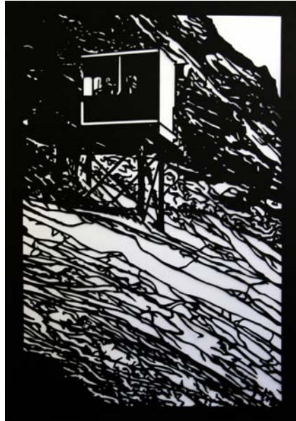
Catherine Ludwig Zugspitze 01, 2017 Karton gerahmt 30 x 40 cm Unikat