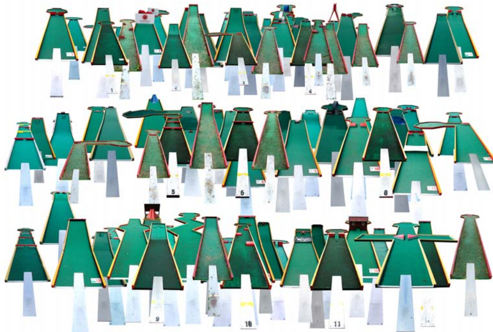
Catherine Ludwig MG-finnische Vielfalt, 2016/18 C-Print gerahmt 40 x 60 cm ed. 4+1

"Catherine Ludwig transcends the traditional divisions between individual artistic media, both in her working process and in the result: metal objects, textiles, videos, animations, sound collages, neon writing, (overlapping) drawings, and photos come together to form a multi-layered installation that speaks with many voices." (Natalie Lettner)