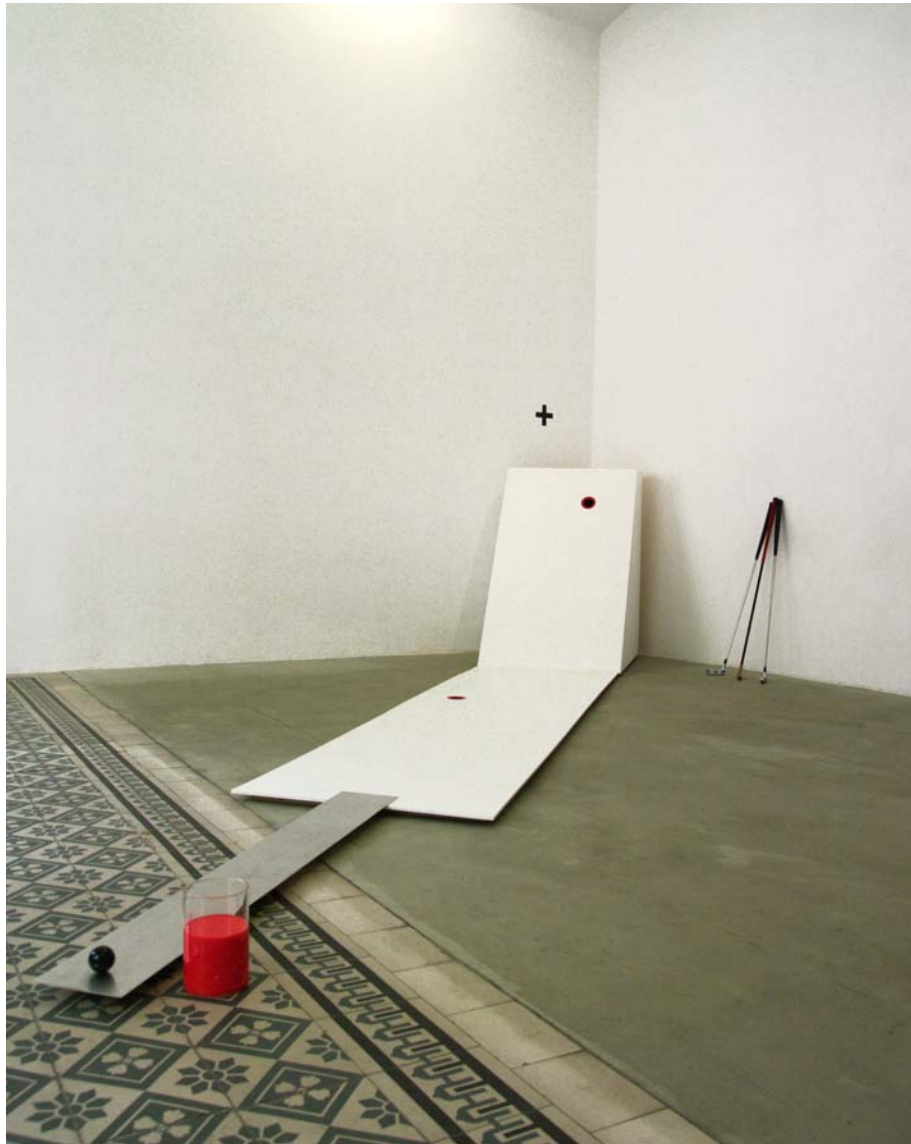
Catherine Ludwig MG-2-Loch-Kreuz, 2018 Holz lackiert, 3 Schläger, rote Farbe 480 x 70 x 100 cm