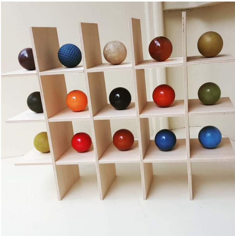
Catherine Ludwig Qual der Wahl, 2018 15 verschiedene Minigolfbälle, Holzsetzkasten 35 x 28 cm Unikat