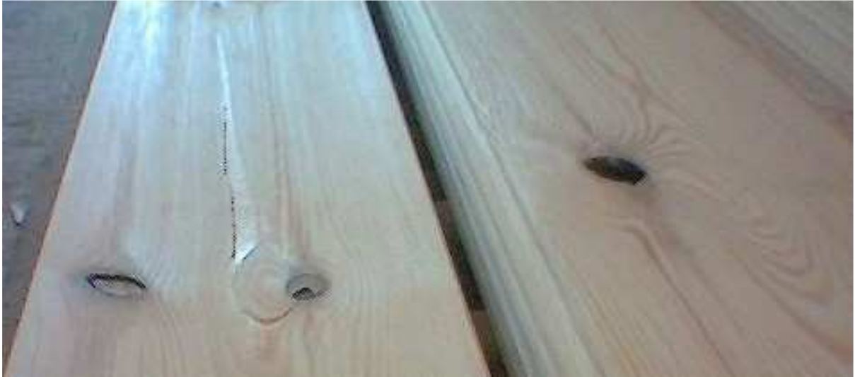
Risse, Ausfalläste, ausgebrochene Stellen,