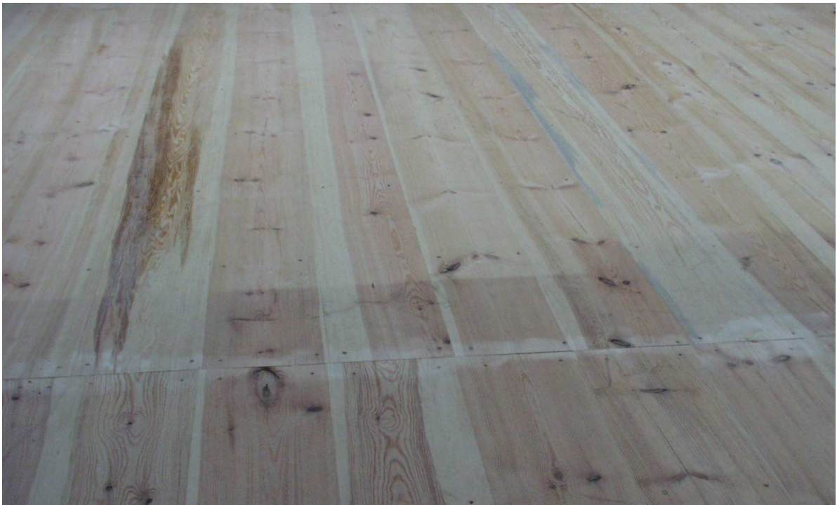
vereinzelt Bläue und stärkere Verkienung