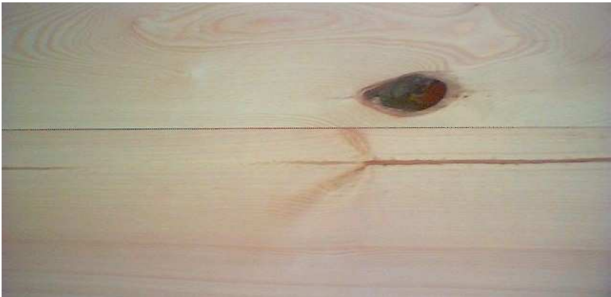
ausgeprägte Markröhre, Fauläste