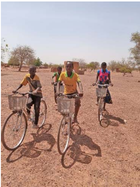
01 Die AbsolventInnen des letzten Jahres fahren bereits mit dem Rad in die Sekundarschule nach Kogho

Dieses und andere Bilder erhalten Sie bei presse@stiftung-bruecke.de