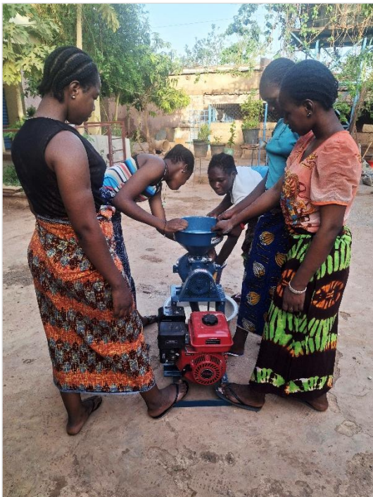
Die Mädchen machen sich mit der Getreidemühle vertraut, die die Stiftung Brücke finanziert hat, um Futter für die Geflügelzucht herzustellen

Spannend für die Mädchen war auch, dass sie mit dem Universitätsgebäude, vom Pritzker Preisträger Francis Kéré entworfen, ein Beispiel wegweisender moderner Architektur kennenlernten. Seine der Region angepassten Bauwerke mit charakteristischer Verschattung und Luftkühlung sorgen schon seit vielen Jahren für Aufsehen.