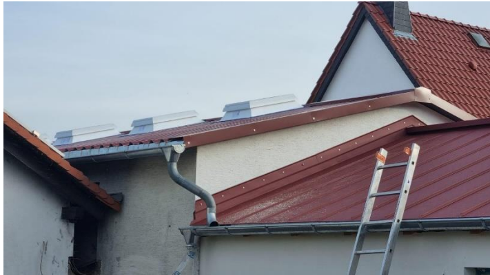
Neue Oberlichter auf dem Gemeindehaus