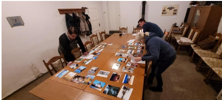
42 eingesendete Fotos musste die Jury bewerten

hatten die Aufgabe, die eingegangenen Bilder ohne Kenntniss der jeweiligen Fotografen zu bewerten. Bilder, die unscharf waren und nicht den Vorgaben des Aufrufes aus der letzten GemeindePOST entsprachen, wurden gleich schon in der ersten Bewertungsrunde selektiert und erreichten damit nicht die zweite Runde, in der dann die besten Fotos gekürt wurden.