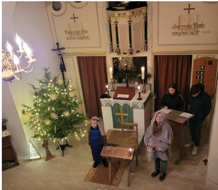
Die Kinder spielten die Weihnachtsgeschichte für uns nach