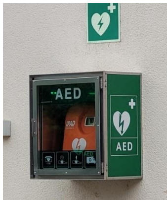
Defibrillator im Dorfzentrum von Tautenburg

Am neuen Gemeindehaus soll ein frei zugänglicher Defibrillator angebracht werden. Ziel ist es, dass dieser zentral erreichbar und schnell verfügbar ist für alle Mertendorfer und Gäste in lebensbedrohlichen Lagen, schneller als der Rettungswagen gegebenenfalls für die Anfahrt benötigt. Bei einem Herzstillstand kann dieser geholt und dem Patienten angelegt werden. Das Gerät arbeitet vollautomatisch und gibt Sprachanweisungen wie lang und wie oft beatmet werden soll. Stromstöße sollen das Herz zum Schlagen bringen. Bereits mehrfach wurden die Geräte zu Lebensrettern.