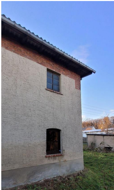
Oben noch alt, unten neu. Die Fenster des Gebäudes

die Scheune etwas mehr in den Investitionsfokus rücken. Tore, Dach und die Umgebung des Gebäudes sollen nach und nach in die Kur genommen werden. Ab 2024 wird in diesem Gebäude die Gemeindetechnik untergebracht. Ebenso wird das Lager der Maibaumgesellschaft Mertendorf e.V. hier beheimatet sein. Um die Erklärung bei Lieferanten und Fördermittelgebern künftig kürzer zu halten, wird das Areal nun „Bauhof Mertendorf“ genannt.