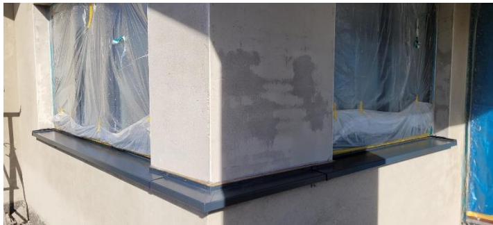
Außenputz und Fensterbank

Am 19. Oktober waren alle Einwohnerinnen und Einwohner zum „Tag der offenen Baustelle“ eingeladen. Neben ausgestellten Plänen und Zeichnungen konnte die Baustelle besichtigt und Fragen gestellt werden.