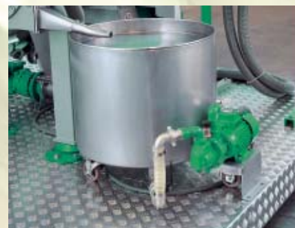
Serbatoio raccolta olio - Oil-collecting tank Réservoir de récolte de l'huile