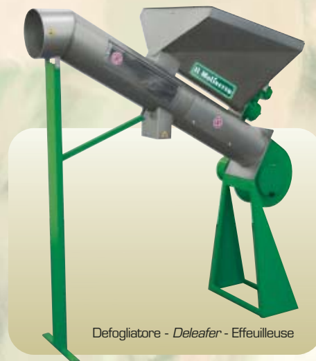
Defogliatore - Deleafer - Effeuilleuse

All accessories can be purchased separately at a later date.