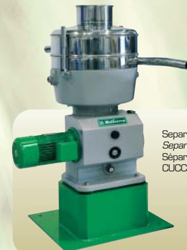
Separatore Separator Séparateur CUCCILO

complet de résistance électrique pour le chauffage de l'eau, thermostat et pompe de recyclage, une pompe mono pour le transfert de la pâte à l'extracteur, un extracteur centrifuge prédisposé pour travailler à deux phases et un tableau électrique général.