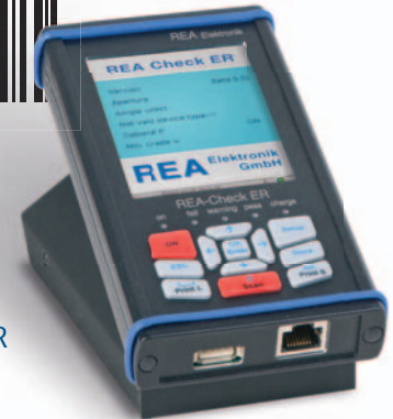
REA Check ER