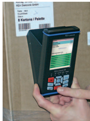
Flexible Barcode-Prüfung vor Ort