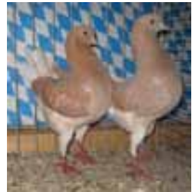
1,1 Dt. Modeneser Schietti gelbfahlgehä. Hv96, JubBd Weinzierl Simon

Franz Hiergeist 4x Dt. Modeneser Schietti dunkelbronzeschildig Voliere 4.4 alt, 2x 1.0 jung und 0.1 jung