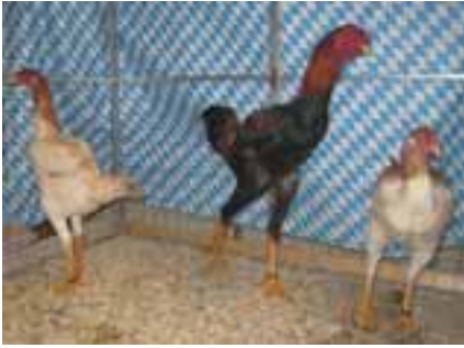
1,2 Malaien gold-weizenfarig v97JubBd, Konrad Huber