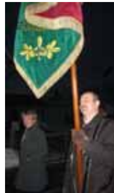
Hier lachen beide, wenn einer schwitzt! Festzug im Winter beim 50-jährigen des GZV Pilsting/Mamming