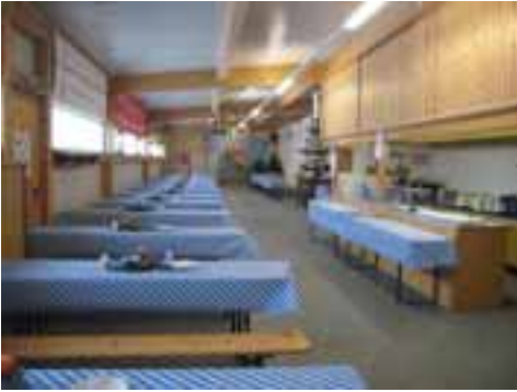
Unser Anbau – festlich (und bayrisch) herausgeputzt