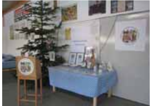
Der „Gabentisch“ und der Christbaum (mit Bändern und Kalender als Geschenke für die Ehrengäste geschmückt)