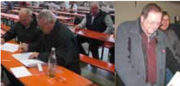
Gelernt ist gelernt: Die Zusammenarbeit war beispielhaft und zukunftsweisend