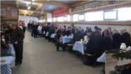
Ca. 140 Gäste haben sich eingefunden