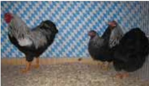
1,2 Zwerg-Wyandotten birkenfarbig sg95 JuWi, Leonie Mildenberger