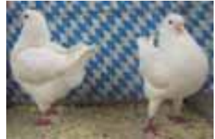
1,1 Kingtauben weiß sg95JubBd Steinbauer Hermann