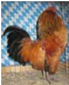
1,0 (sg95LVP) und 0,1 (hv96JubBd) Antw.Bartzwerg gelb-schwarzcolumbia, Alexander Kaiser