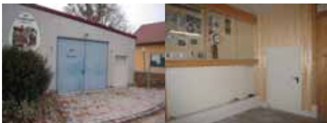
Links: 10 Jahre haben wir uns über den Eingangsbereich geärgert, doch Gut Ding hat lange Weile!