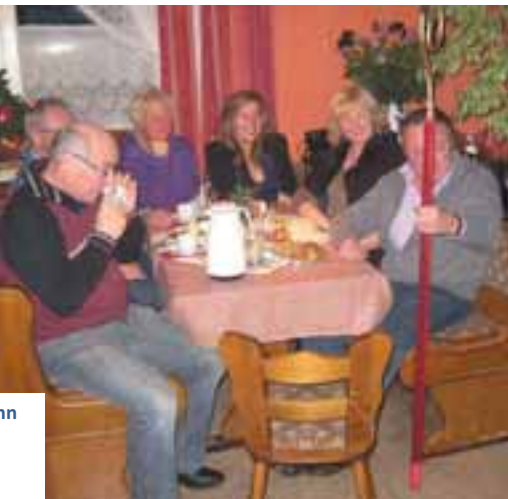
Erst ziert er sich noch ein wenig ..., aber dann nimmt er den schweren Stab an sich!