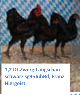
1,2 Dt.Zwerg-Langschan schwarz sg95JubBd, Franz Hiergeist