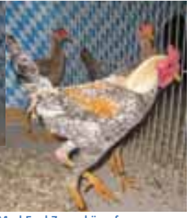
1,2 Mod.Engl.Zwergkämpfer kennfarbig sg94JubBd, Reinhard Kaiser