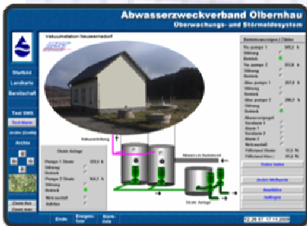
Störmeldesystem des AZV Oibernhau Aufschaltung einer neu errichteten Vakuumstation