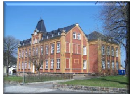
Thomas-Müntzer Grundschule Erneuerung der MSR Anlage