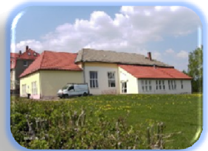
Turnhalle Marbach Einbau einer Wärmerückgewinnung in die bestehende Lüftungsanlage