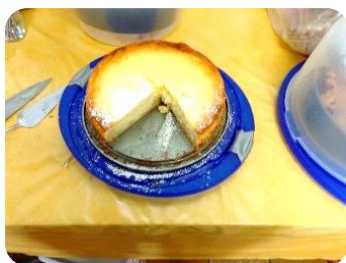
Einer von Richildes in 2014 selbst gebackenen Kuchen.