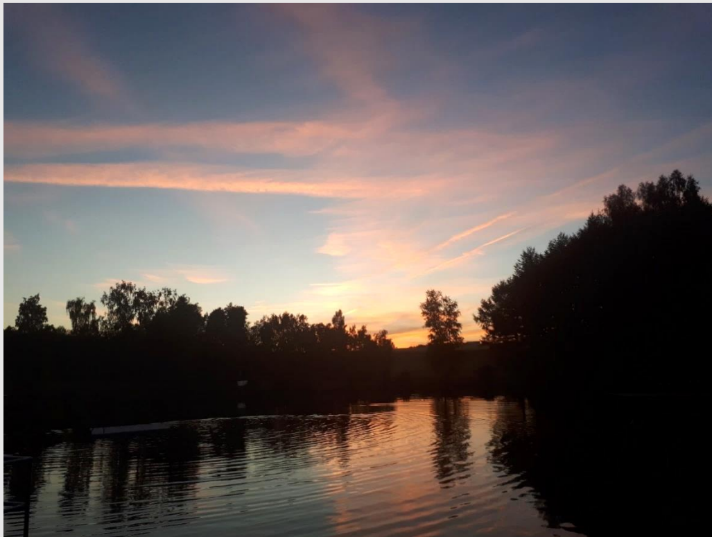
Abend- und Herbststimmung im Waldbad