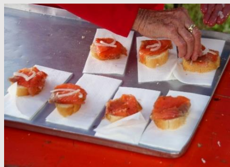
Fischereibetrieb Fuchs Lachsforelle auf Baguette