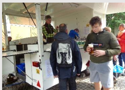
Brauerei Nothhaft Getränk (mit/ohne Alkohol)