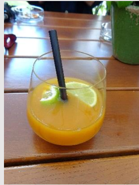
Hotel Soibelmans Mixgetränk (mit/ohne Alkohol)