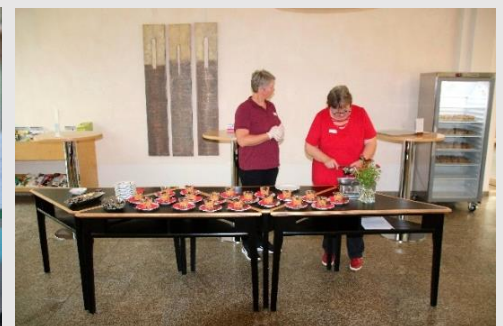
EBZ Bad Alexandersbad Bulgursalat