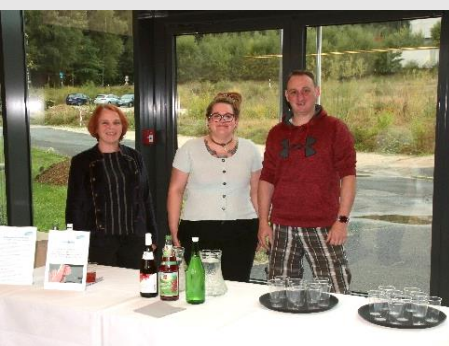
AlexBad Mixgetränke mit Sauerbrunnen (mit/ohne)