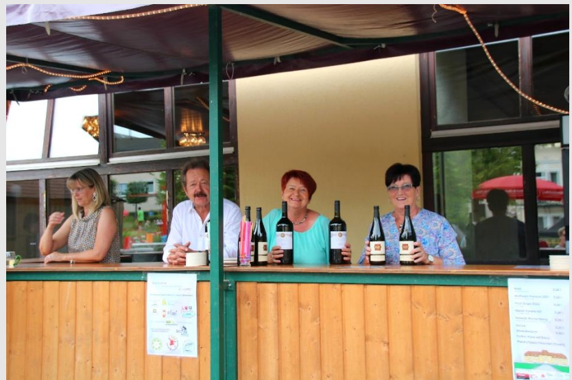
Der Weinstand am Haus des Gastes, das der Förderverein Historisches Badehaus zusammen mit dem Förderkreis Waldbad betrieb.