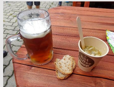
Brauerei Hönicka – Getränk (mit/ohne) Metzgerei Reichel – Saure Zipfel