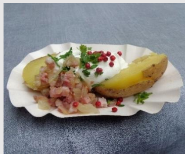
Schweizerhaus Kartoffel mit Quark