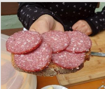
Ferienhof Fichtelgebirge Hirschsalamibrot