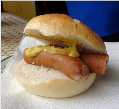
Förderkreis Waldbad Käsewiener in Minisemmel