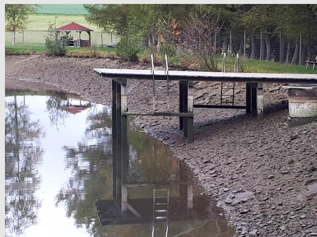
Das Abfischen kann beginnen