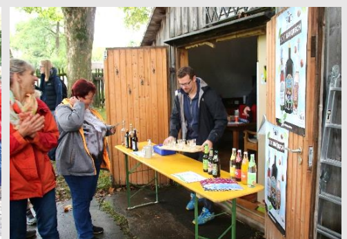
FGV Bad Alexandersbad Schnaps bzw. alkoholfreies Getränk