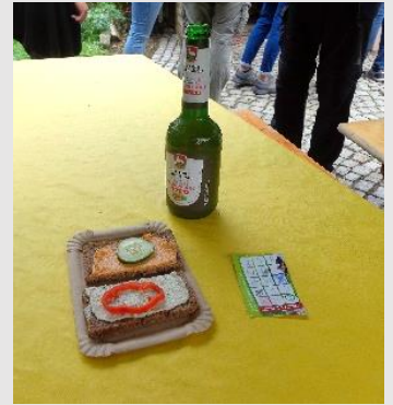
Der Bio-Bote Vollkornbrot mit 2 versch. Aufstrichen + 1 alkoholfreies Getränk