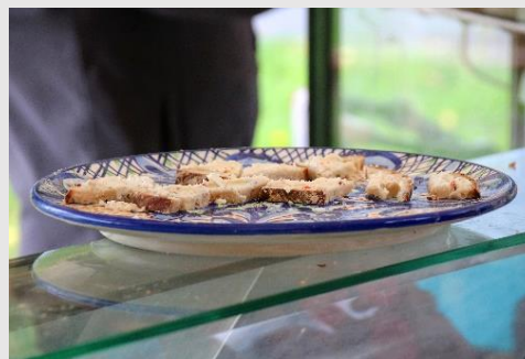
Bauernhof Neuhausener Weide Schafskäse