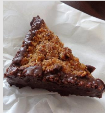
Das Logierhaus Nussecken