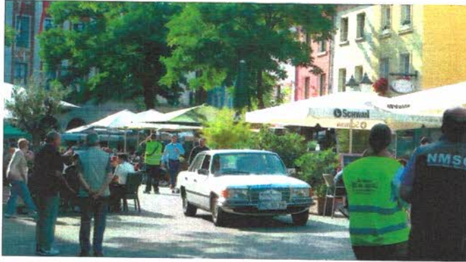
Es geht traditionell zu den Sehenswürdigkeiten des "Rhein Kreis Neuss" und endet auf dem Neusser Markt. Corona-bedingt gab es nur eine Durchfahrt mit Abgabe der Stempfkarte und keine Fahrzeugvorstellung. Trotzdem sind viele Zuschauer gekommen. Natürlich mit Abstand!