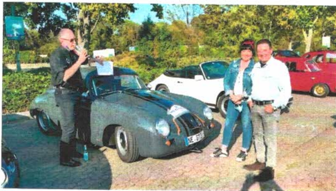
Fahrzeugvorstellung mit seltenem Porsche für LeMans vorbereitet.