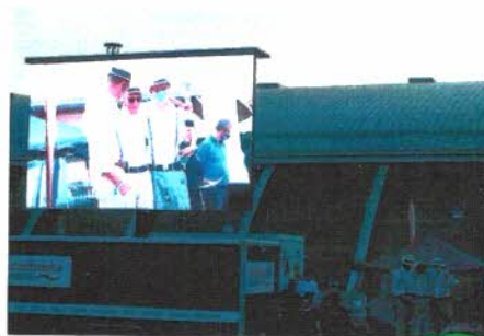
Dank der Stadtwerke Neuss Stegerehrung auf Distanz. Kurzfristig eingesprungen.