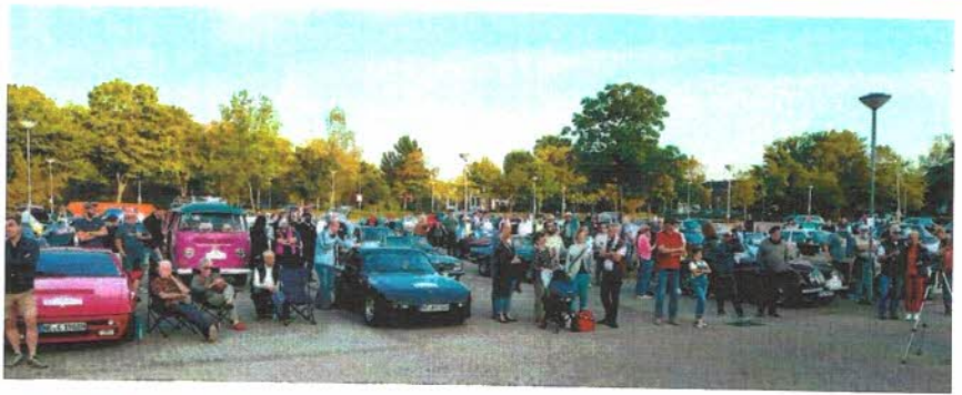
... und zuvor die Fahrerbesprechung. Draußen.