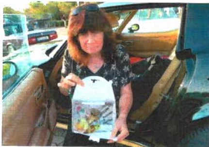
Superleckere Abendessenbox für hungrige Teilnehmer.