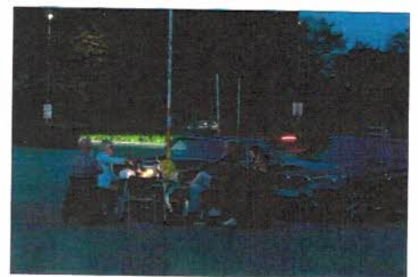
Picknickstimmung bis in die späten Abendstunden.

FAZIT: Viel gewagt und viel gewonnen. Trotz allem unverschuldeten Chaos während der Vorbereitung bewiesen die Neusser Motorsportler nicht nur Nerven sondern auch Durchhaltewillen und Fantasie und hatten das Glück der tüchtigen, dass Hilfe in höchster Not von unerwarteter Seite kam. 101 Teilnehmer, Sieger und Platzierte, Zuschauer auf Distanz; alle fuhren nach einem ereignisreichen Tag zufrieden nach Hause. Wer Interesse an einer Teilnahme 2021 hat muss sich früh anmelden und das 2. September-Wochenende 2021 freihalten.