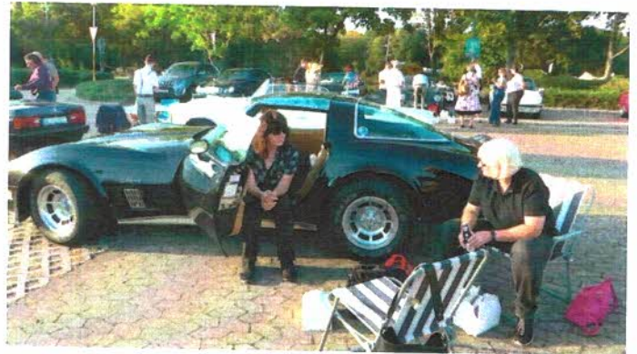
Unprätentiöses amerikanisches Picknick. Nicht nur wagen der Corvette.