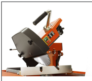
ROBUSTER UND ZUVERLÄSSIGER MOTOR Sorgt für eine lange Lebensdauer.

Die TS 350 E ist eine effiziente Steintrennsäge mit hoher Schnittleistung für verschiedene Baustoffe. Diese Tischsäge bietet eine maximale Schnitttiefe von 100 mm einfach oder bis zu 200 mm im Umkehrschnitt. Kapp- oder Gehrungsschnitte bis 45° sind problemlos möglich und gewährleisten eine optimale Anwendbarkeit. Der robuste Einzelrahmen bietet hohe Stabilität und eine lange Lebensdauer. Die Maschine kann aufgrund der klappbaren Standbeine problemlos von einer Person gehandhabt werden.