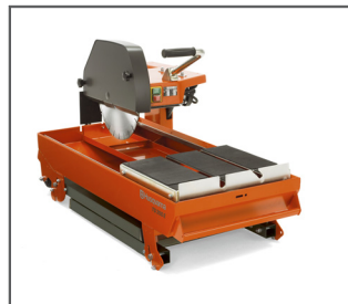
EINFACHER TRANSPORT UND AUFBAU Dank der klappbaren Standbeine.