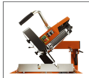
VIELSEITIG Kapp- und Gehrungsschnitte von 45° oder 90° für optimale Anwendbarkeit.