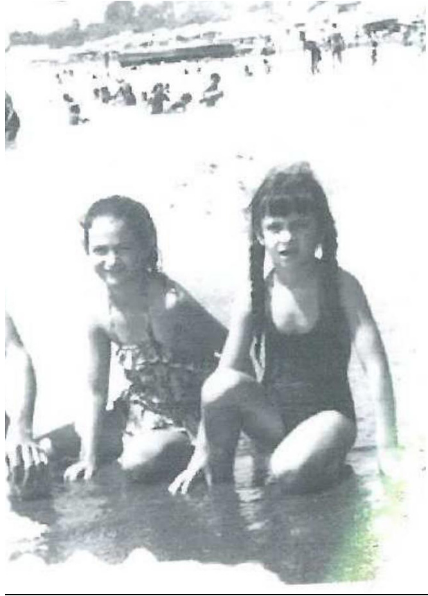
Conchi con su hermana en la playa