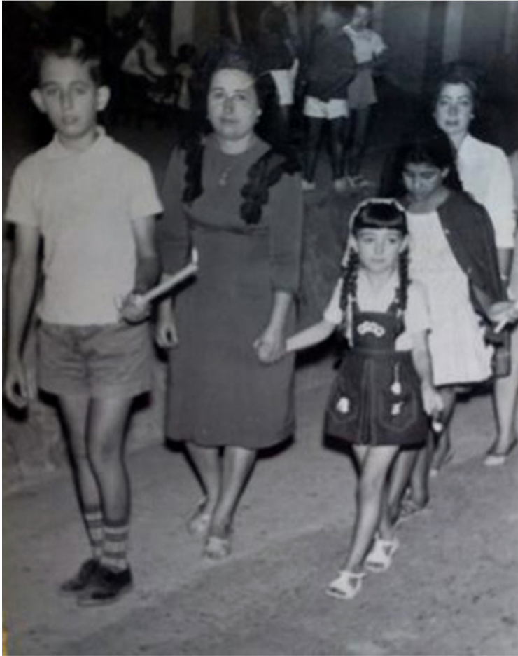
Fela con su madre y hermano