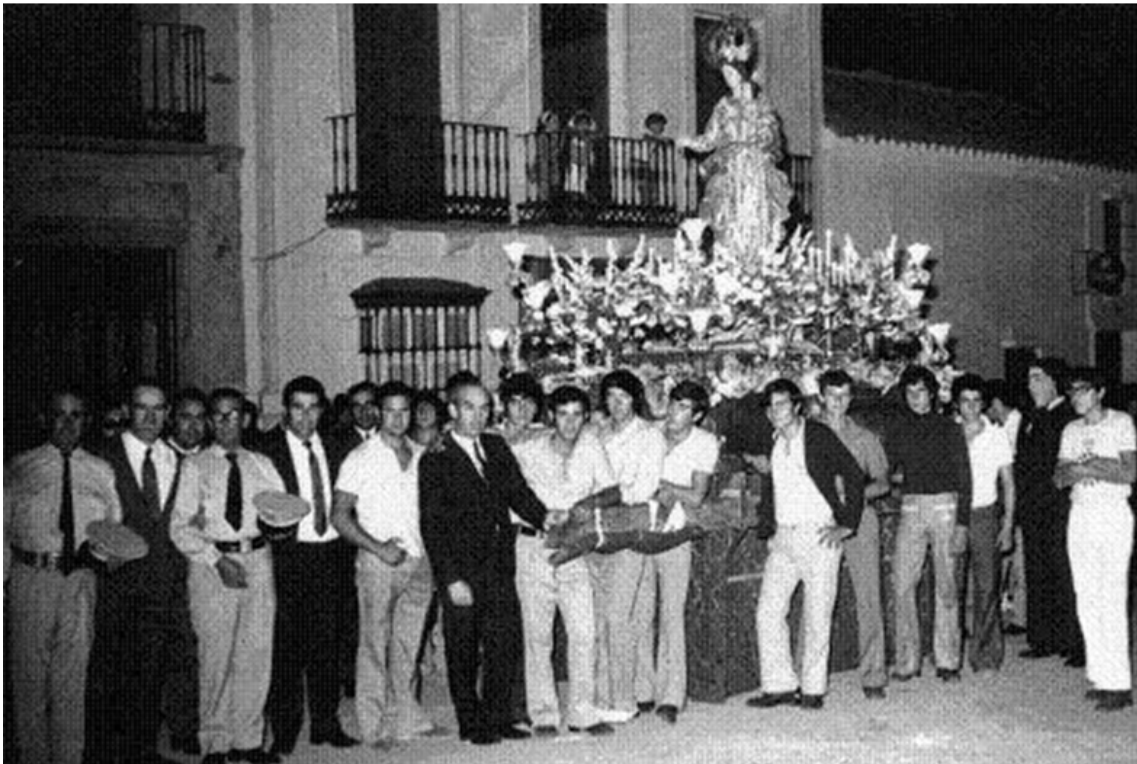
Ura. Sra. de las Virtudes en procesión antes de entrar a su templo