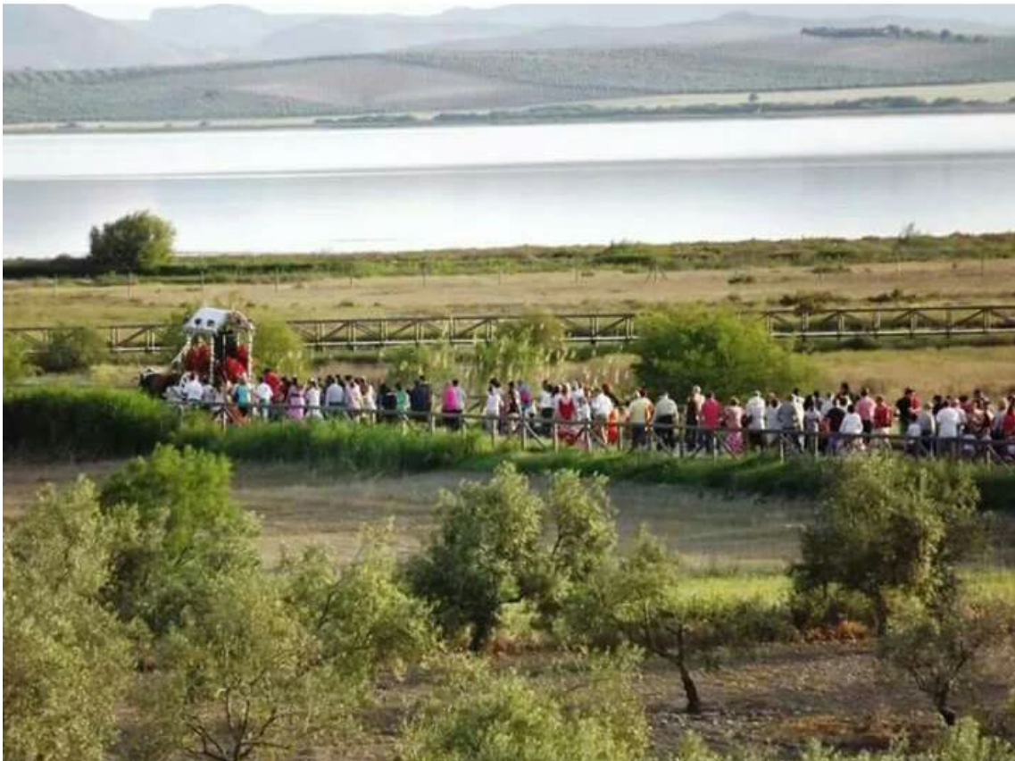
Paso de la carroza por el camino de Matalondras con La Laguna al fondo