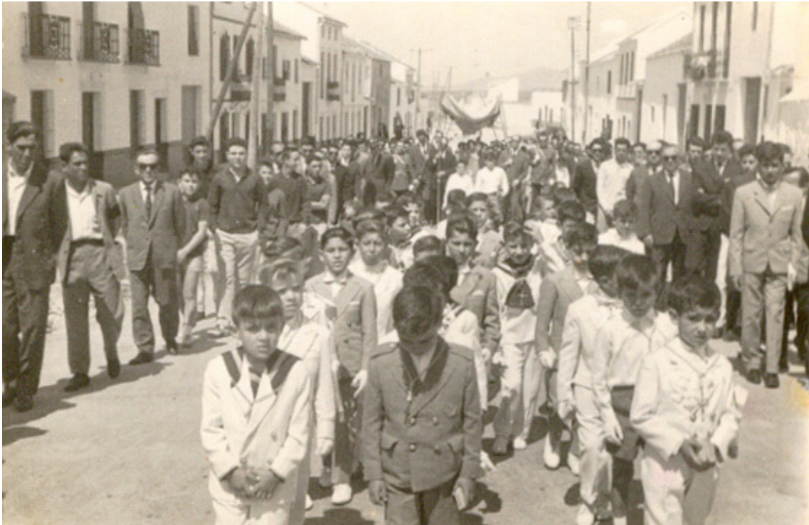
(21-6-62) Los jóvenes que hicieron la Primera Comunión procesionan el día del Corpus.