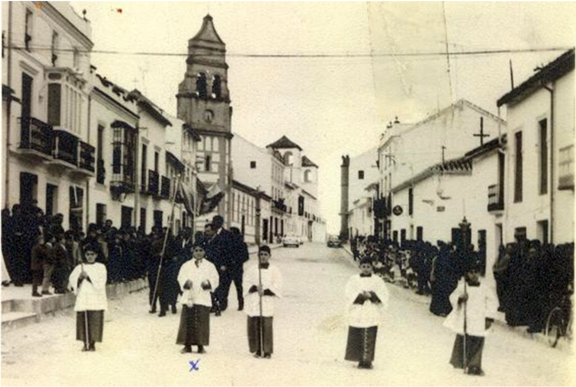
1962.- Procesión para llevar bajo palio al Sr. Obispo que nos visita con motivo de la confirmación masiva llevada a cabo ese año. Los niños esperan a ambos lados de las aceras de la calle, entonces llamada Francisco Luque.