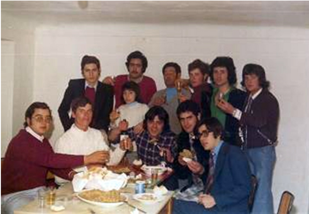
Quinta del 55: