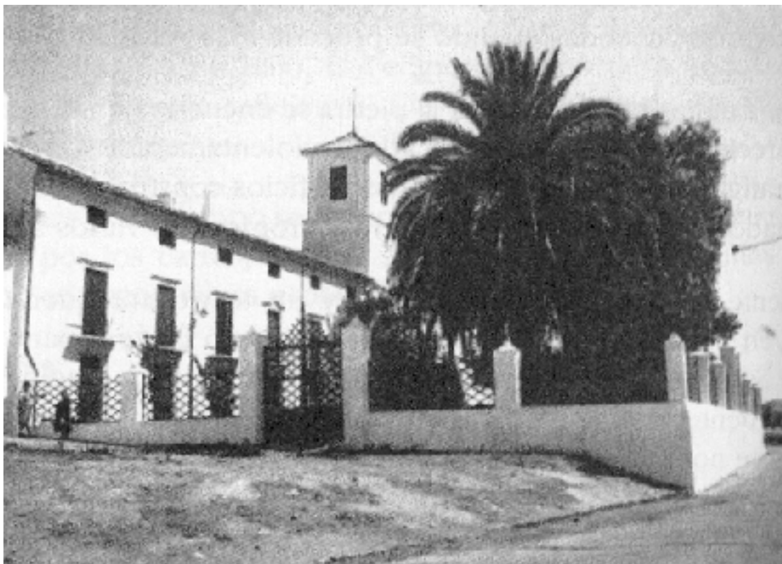
Aspecto que presenta la casería de Las Pininas hasta los años 80 en que se inicia su constante deterioro.