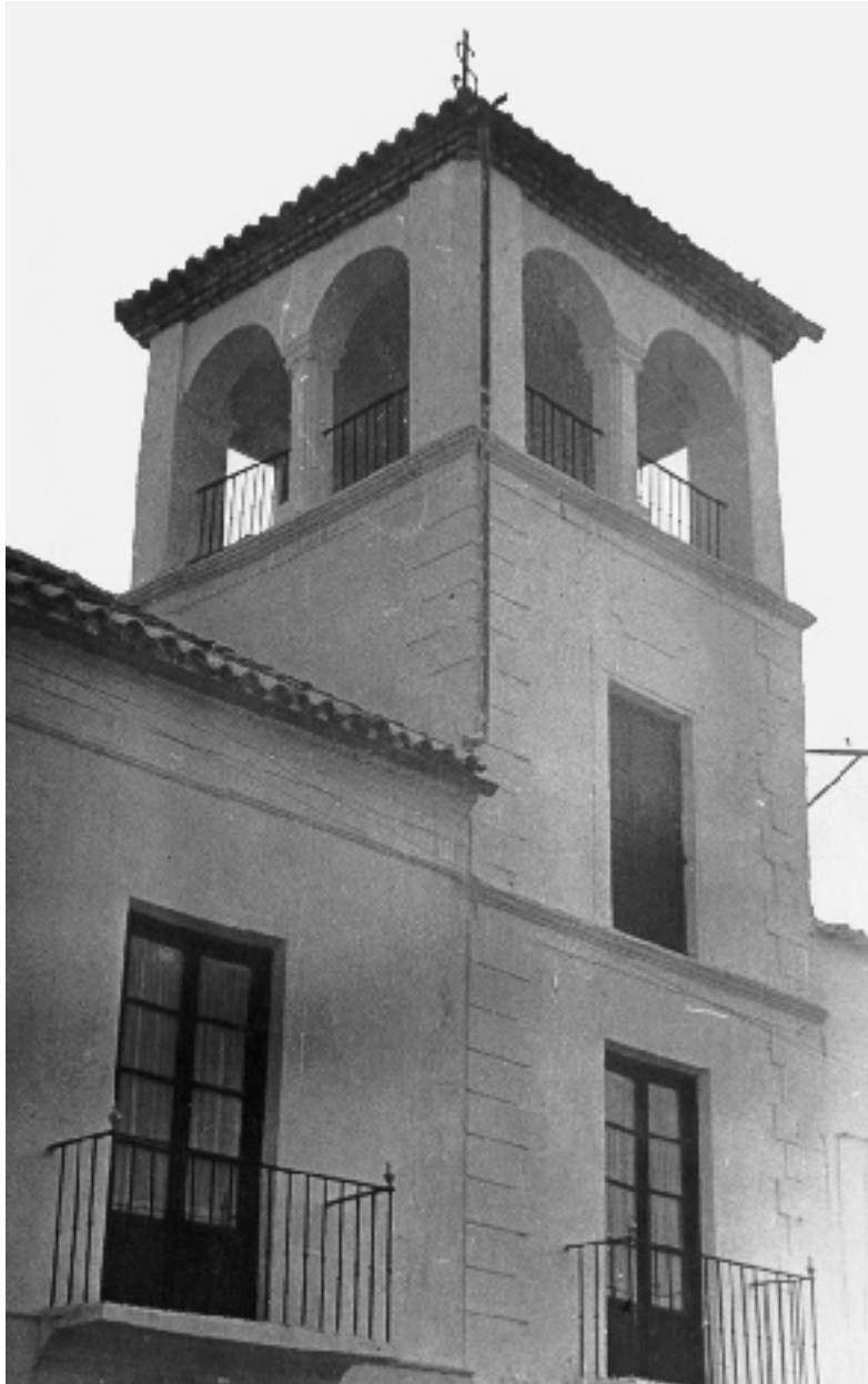
Detalle de una de las torres y de la balconada del piso superior.

Desgraciadamente, la casa-palacio del Marquesado de Fuente de Piedra no la podemos contemplar ya, ni siquiera en ruinas. El solar que ocupara este palacete, obra de finales del siglo