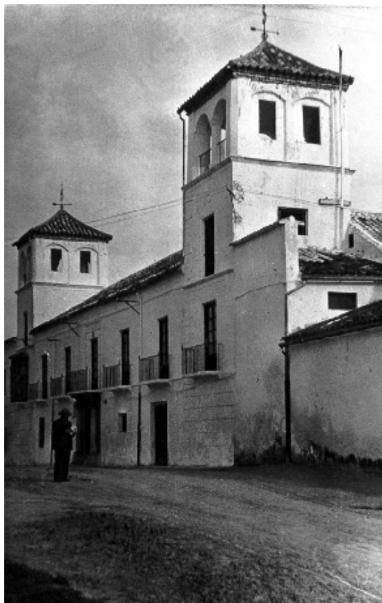
El palacete a principios del siglo XX y detalle del acceso principal