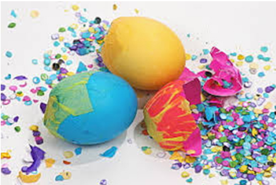
Huevos de carnaval rellenos de guasa.