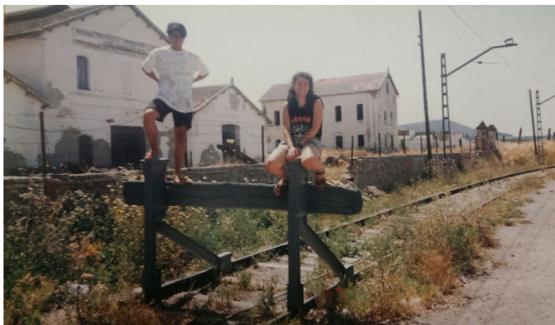
El complejo en constante deterioro