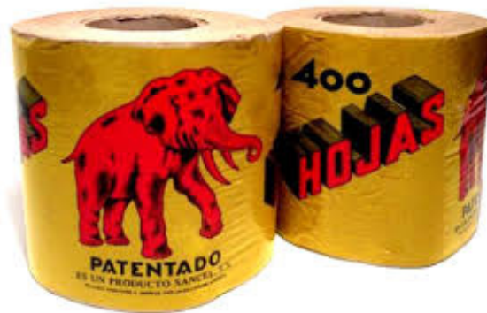
El Elefante, papel higiénico.

Por razones obvias, antes había más moscas y la forma de combatirlas era con la cinta adhesiva para enrollar al cable del que pendía la bombilla de la luz o pulverizando con el aparato Flit, que dejaba un olor muy agradable, pero tóxico.