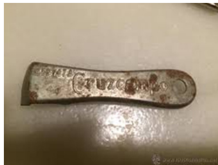
Botellin de Cruzcampo, calendario de bolsillo y abridor.