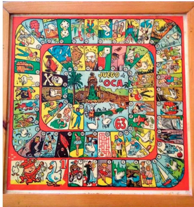
Juegos de la Oca, Parchís y Damas