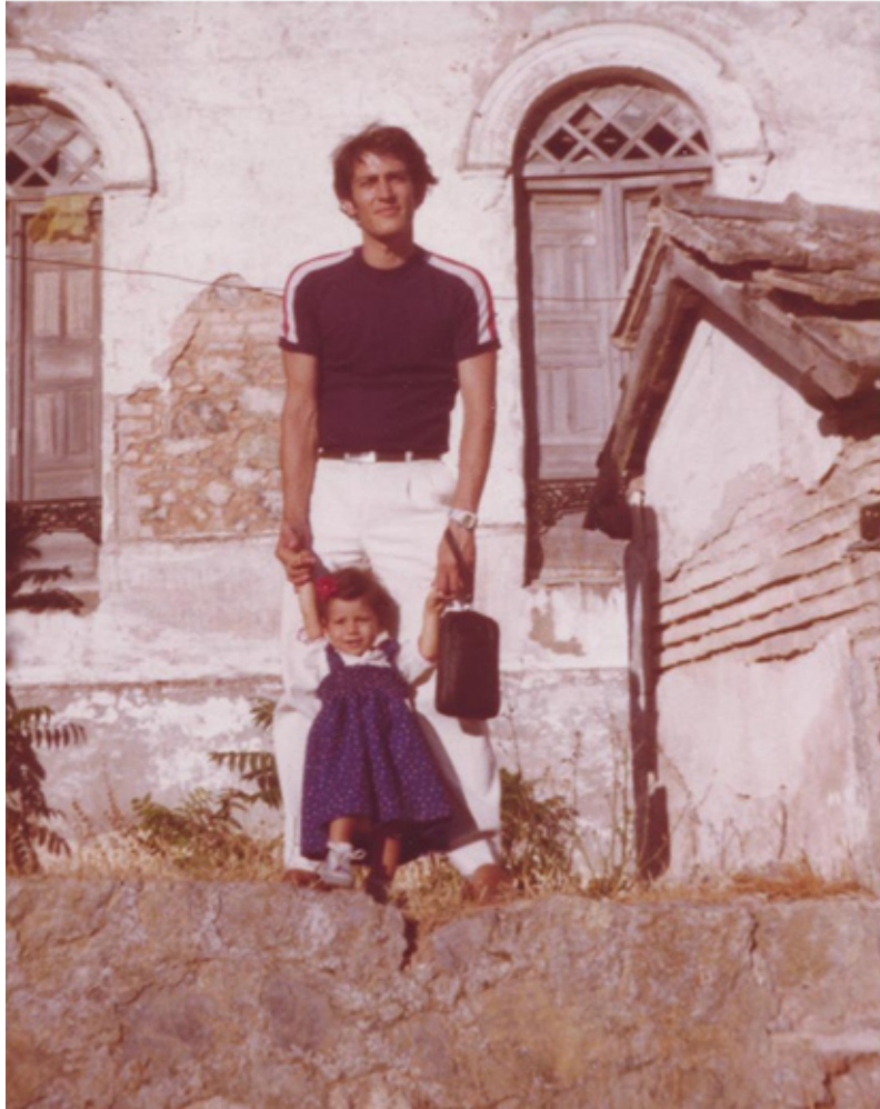
Las viviendas de la fábrica de abonos