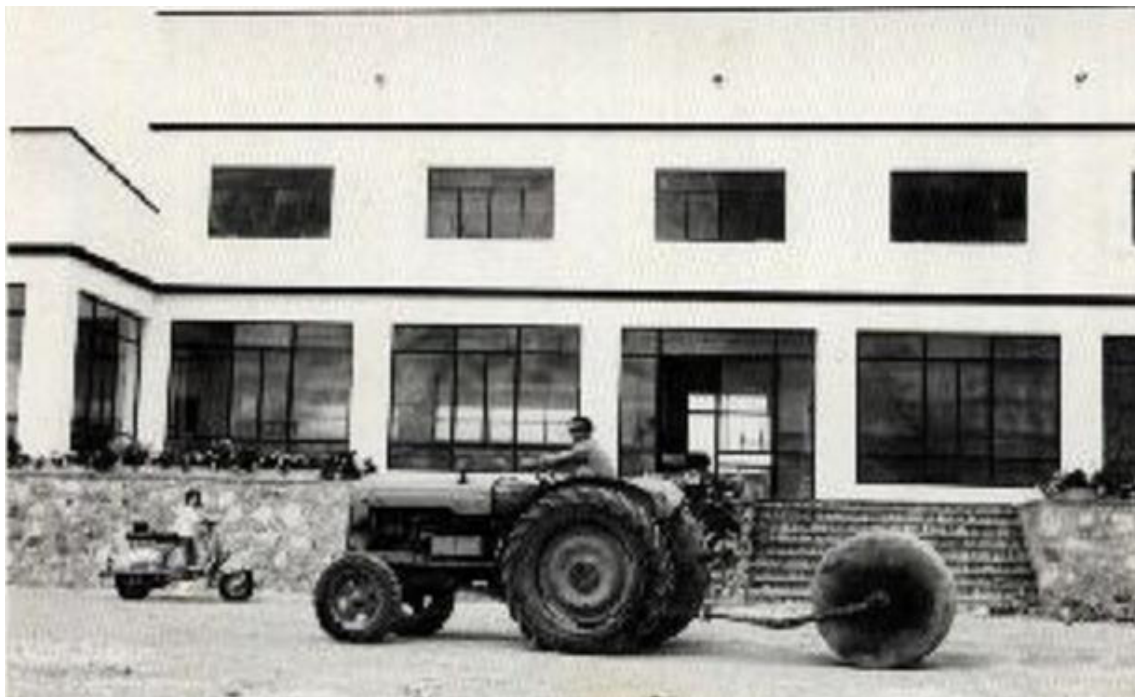
Hostal D. Málaga y piscina.