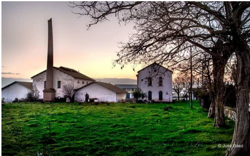
Aspecto que presentaba en los años 80