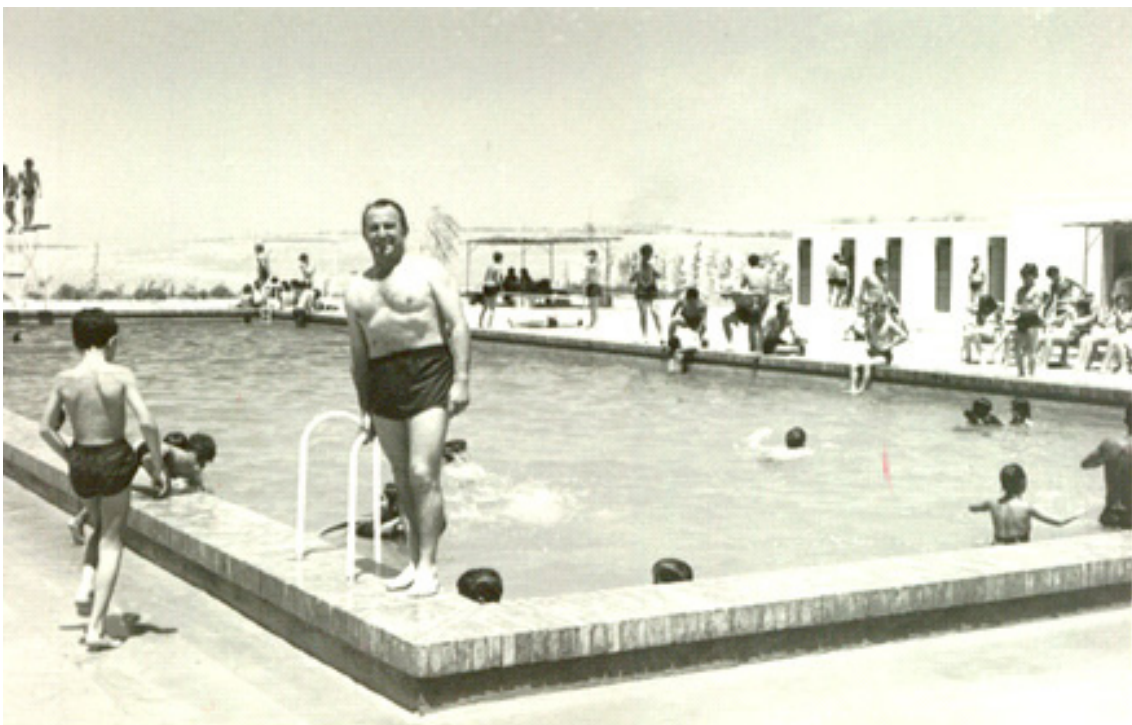
La piscina en sus años de apogeo.