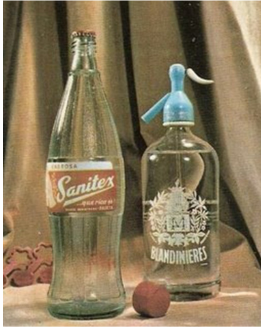
Envase gaseosa Sanitex, agua de Seltz.