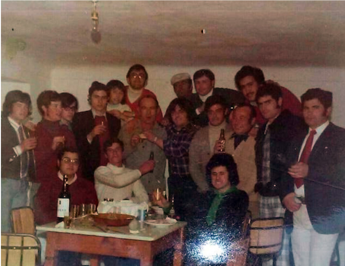
Quinta del 55 y varios vecinos