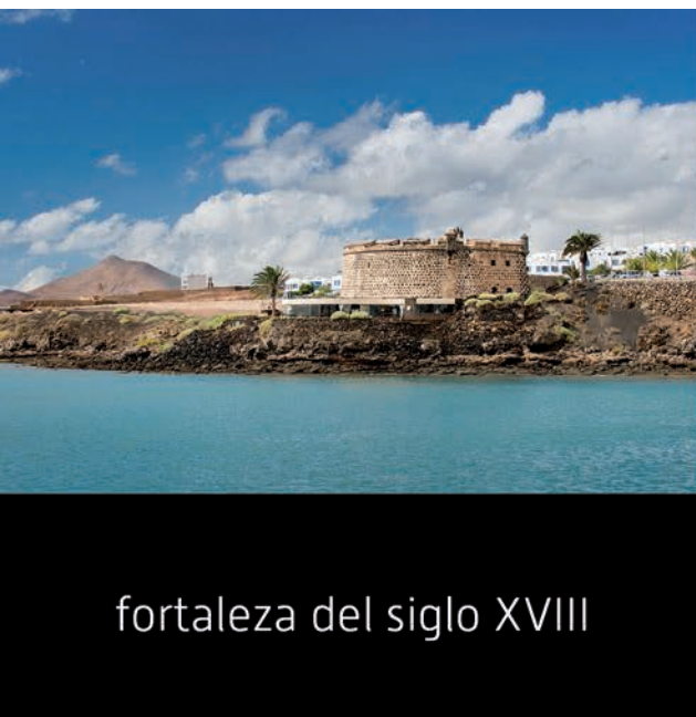
fortaleza del siglo XVIII