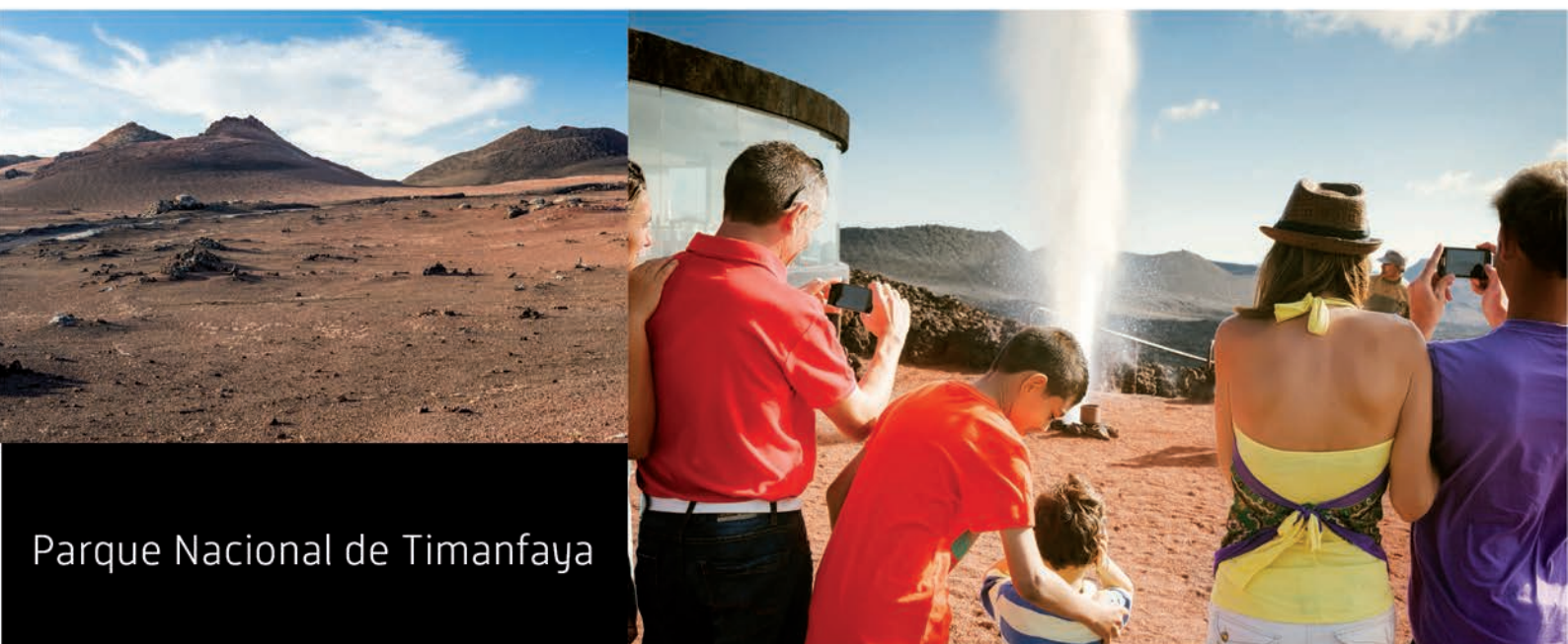
Parque Nacional de Timanfaya

Le recomendamos las fotografías en la zona de los Géiseres, el Horno Natural, la figura del Diablo y durante la Ruta de los Volcanes le recomendamos quitar el flash para una mejor calidad de imagen.