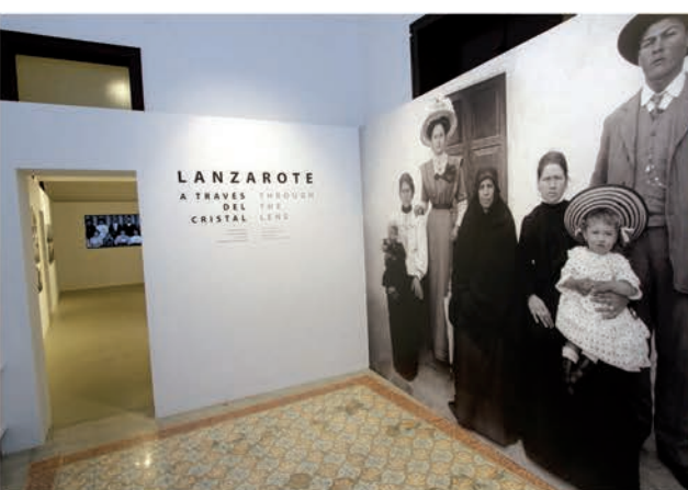
Memoria de Lanzarote