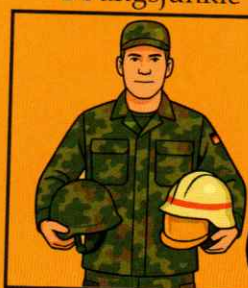
Der vielseitig Engagierte