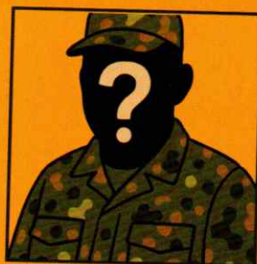
Die fehlende Generation