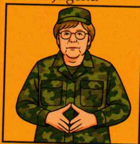
Kann nicht loslassen