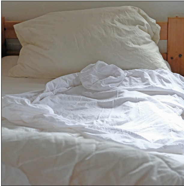
Heilig ist mir ... mein Bett (junge Frau).