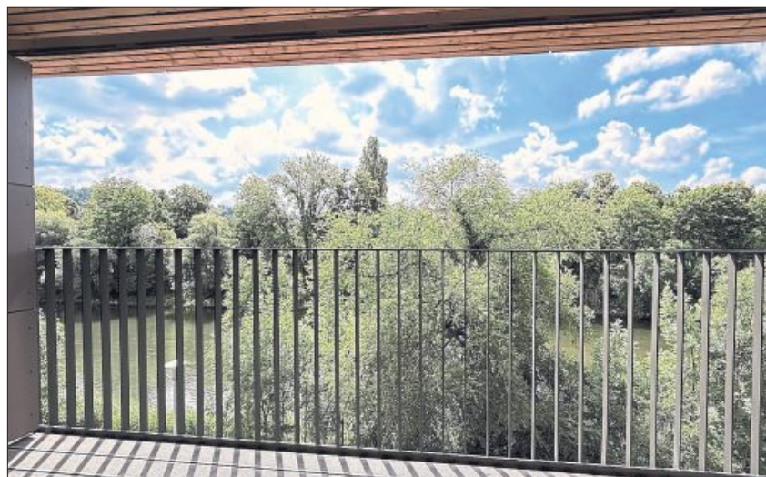
Jedes Zimmer hat einen Außenzugang.

nen Plätze sicher weiter in der Kurzzeitpflege verwenden. Die Modernisierung dauere nun jedoch aus finanziellen Gründen länger als ursprünglich gedacht. Von der Bayerischen Staatsregierung werde die Sanierung des Spitals jedoch mit sieben Millionen gefördert – „eine sehr freudige Nachricht“, so das Stadtoberrhaupt.