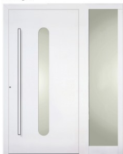
Füllung Z4 mit Seitenteil (optional)