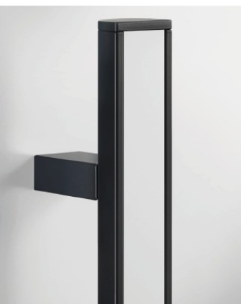
hochwertiger schwarzer Stangengriff mit Einleger in Füllungsfarbe