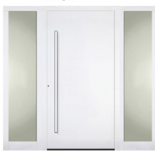
Füllung Z5 mit zwei Seitenteilen (optional)