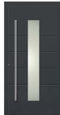
M10 | DB 703 Dunkelgraumetallic