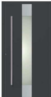
M5 | DB 703 Dunkelgraumetallic