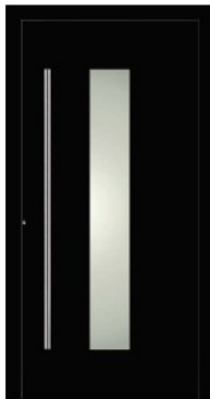
M2 | RAL 9005 Tiefschwarz