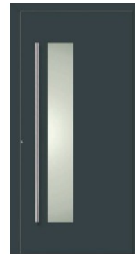
M8 | RAL 7016 Anthrazitgrau