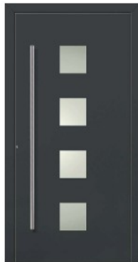
M3 | DB 703 Dunkelgraumetallic