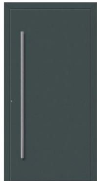
M1 | RAL 7012 Basaltgrau