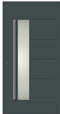
M9 | RAL 7012 Basaltgrau