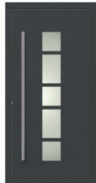
M6 | DB703 Dunkelgraumetallic