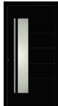
M11 | RAL 9005 Tiefschwarz