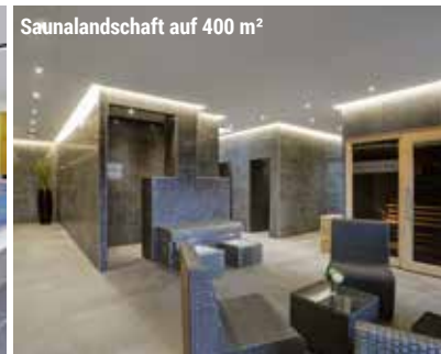
Saunalandschaft auf 400 m 2

Erleben Sie im 4-Sterne-Parkhotel CUP VITALIS in Bad Kissingen romantische Weihnachtstage und einen unterhaltsamen Jahreswechsel. Im Hotel empfangen wir Sie mit einem Glas Sekt. Entdecken Sie Bad Kissingen bei einem winterlichen Spaziergang mit Abschluss-Glühwein. Bei diversen Unterhaltungsabenden kommen Sie so richtig in Weihnachtsstimmung . Mit Ihrem Anwendungspaket nach Wahl bleiben Sie auch während der Feiertage aktiv und entspannt. Zur Musik von Pit's Profi Sound und Kay's One Man Band starten sie beschwingt in das neue Jahr und begrüßen es am Neujahrstag mit einem Brunch und einer Feuerzangenbowle .