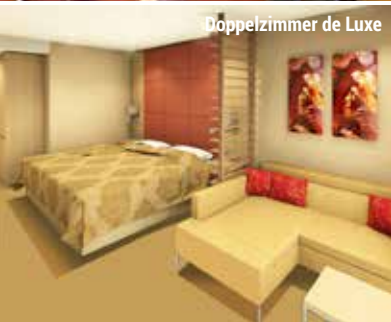
Doppelzimmer de Luxe