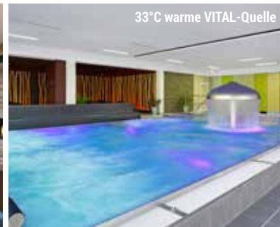
33°C warme VITAL-Quelle