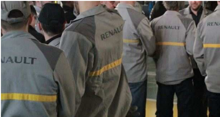
Un salarié de l'usine Renault-Sandouville près du Havre (Seine-Maritime) a tenté de mettre fin à ses jours sur son lieu de travail, lundi 3 avril 2017.

Publié le 5 Avr 17 à 10:20 / Modifié le 5 Avr 17 à 10:08 Voir les commentaires