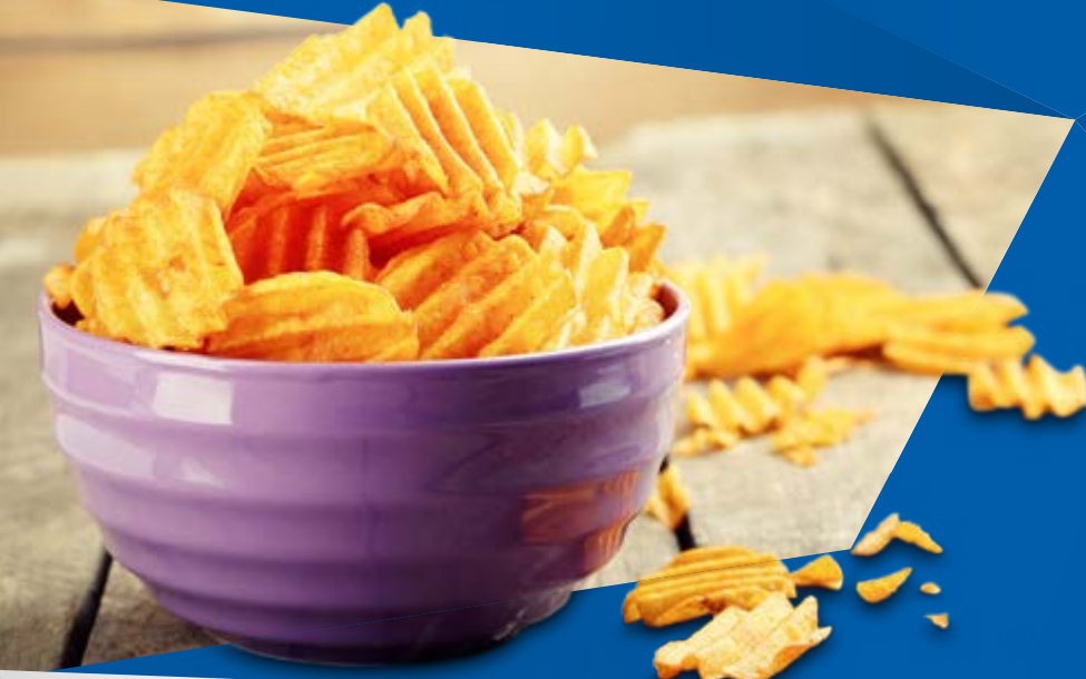
Chips VOM Band