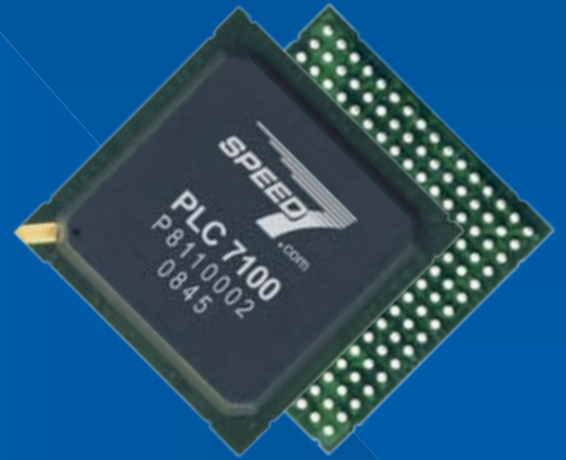
Chips FÜRS Band

Und was sichert Ihren Vorsprung? Speed, SPEED7, um genau zu sein!