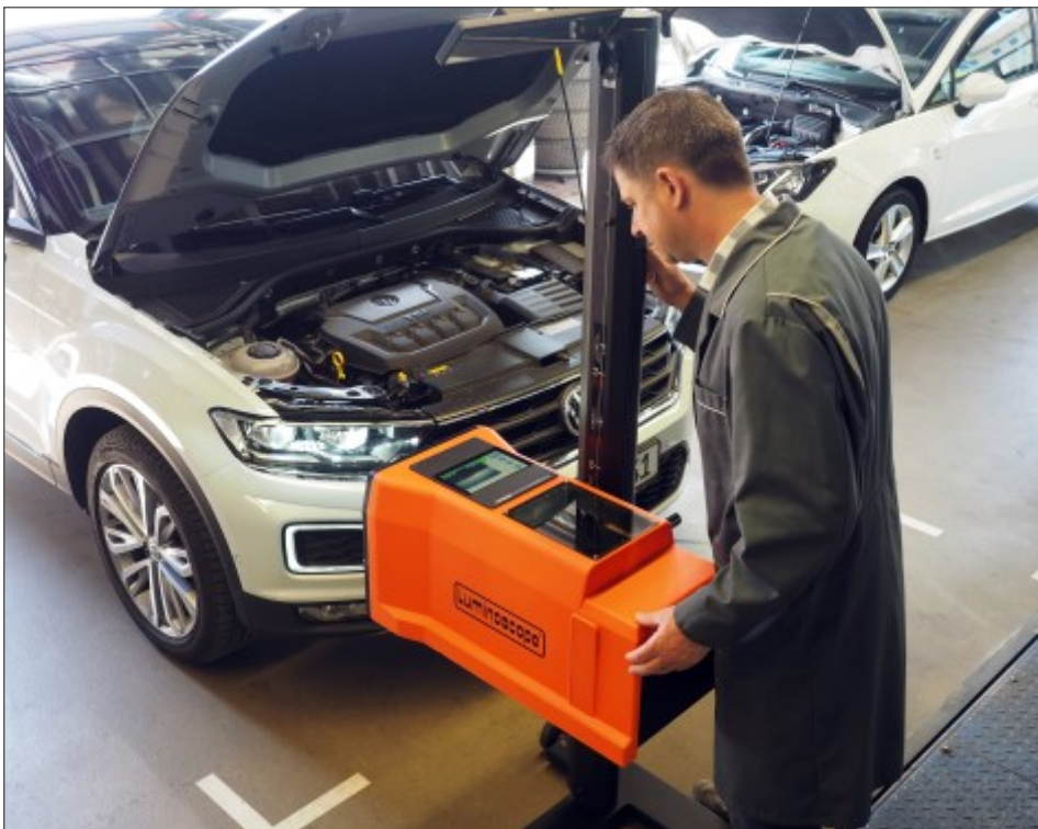
Digitales Scheinwerfer-Einstell-Prüfgerät (SEP) mit automatischem Nivellierausgleich